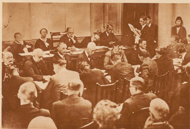
Der Scheinprozeß in London. In London tagt jetzt der seit langem angekündigte «Gegen-» oder «Schein-Prozeß» um den Reichstagsbrand. Berühmte Rechtsanwälte aus verschiedenen Ländern sind bei dem Prozeß beteiligt. Die deutsche Regierung hat in der Sache bei der englischen Regierung ohne Erfolg Protest erhoben. Unser Bild zeigt eine Sitzung der beteiligten Anwälte im Saal der Law-Association