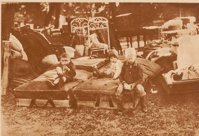
Die Brandkatastrophe von Oeschelbronn. 203 Gebäude, darunter 83 Wohnhäuser, des Ortes Oeschelbronn sind der Feuersbrunst zum Opfer gefallen. 400 von den 1500 Einwohnern sind obdachlos. Menschenleben sind keine zu beklagen. Bild: Gerettete Habe