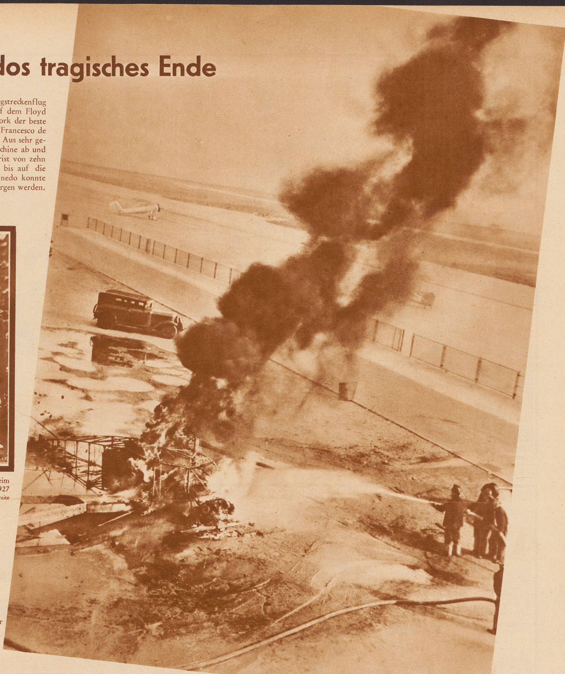
Die Flugplatzfeuerwehr bei der Löscharbeit