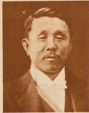
Koki Hirota der neue japanische Außenminister