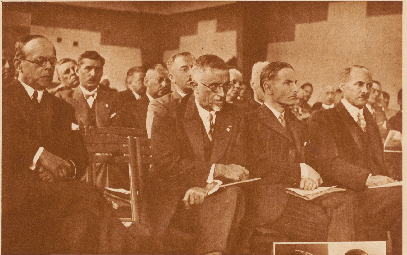
Die Auslandschweizertagung in Lausanne. Am 15. und 16. September fand in Lausanne die von der Auslandschweizer-Kommission der «Neuen Helvetischen Gesellschaft» organisierte 12. Tagung der Auslandschweizer statt. Die Tagung war besetzt von einer Elite von Vertretern unserer Schweizerkolonien aus fast allen Ländern der Erde. Unser Bild zeigt: vordere Reihe vier Prominente der Tagung, die sich besondere Verdienste um die Sache der Auslandschweizer erworben haben. Von links nach rechts: Minister R. de Weck, der Schweizer Gesandte in Bukarest; Dr. Ch. Bernard, ehemaliger Minister für Ackerbau, Industrie und Handel von Niederländisch Indien; Minister M. de Stoutz, Abteilungschef beim Politischen Departement; G. A. Golliez, langjähriger Schweizerkonsul in Batavia