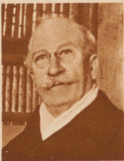
Alexandro Lerroux der neue spanische Ministerpräsident