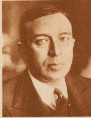
Prof. Dr. Max Alsberg der berühmte Berliner Strafverteidiger und juristische Schriftsteller, ist in Samaden freiwillig aus dem Leben geschieden