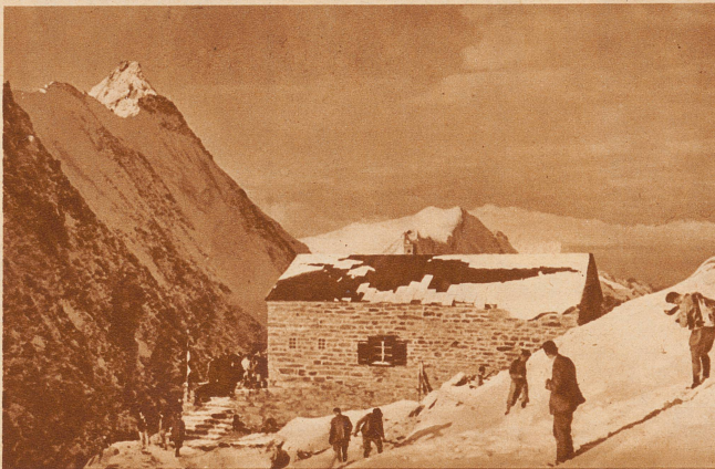
Die «Hollandia»-Klubhütte an der Lötchenlücke. Das neue Berghaus gehört der Sektion Bern des S. A. C. und wurde an Stelle der alten Egon von Steigerhütte erbaut. Es steht auf 3236 Meter Höhe an der viel begangenen und befahrenen Route Jungfrauoch-Konkordia-Lötchentental. Von Jungfrauoch ist die Hütte in 4-5 Stunden, von Goppenstein in 8-9 Stunden erreichbar. Der zweckmäßige Steinbau enthält 48 Schlafplätze. An die Kosten der Erstellung, die sich auf rund 80 000 Franken belaufen, hat der Holländische Alpenverein 25 000 Franken beigesteuert