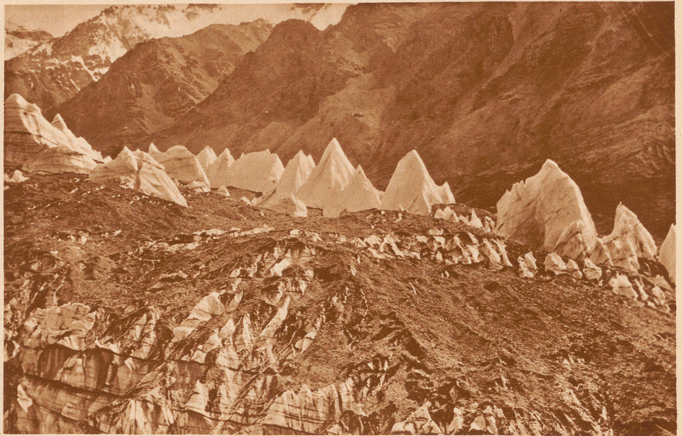
Pfadfinderzelte? Nein, diese seltsamen Eispyramiden sind die Ueberreste eines zurückgegangenen Gletschers im Karakorum-Gebirge

Als ich während der ersten paar Tage die Küche betrat, standen die beiden Tische da, fleckenlos und unberührt. Alles war auf dem Boden, Gemüse, Tischgeschirr, Töpfe, Pfannen, Staub- und Geschirrtücher. Eine gewaltige Schlacht hob zwischen mir und dem Koch an. Er schien sehr willig, mir bei meinen Bestrebungen zu helfen, meine Küche zum mindesten auf Tischhöhe zu heben. Aber auf irgendeine seltsame Weise waren die Sachen jedesmal, wenn ich unerwarteterweise in die Küche trat, wieder auf den Boden gerutscht. Nach Wochen nutzlosen Auftritts siegten die Gemüse- und Kochtöpfe und blieben am Boden.