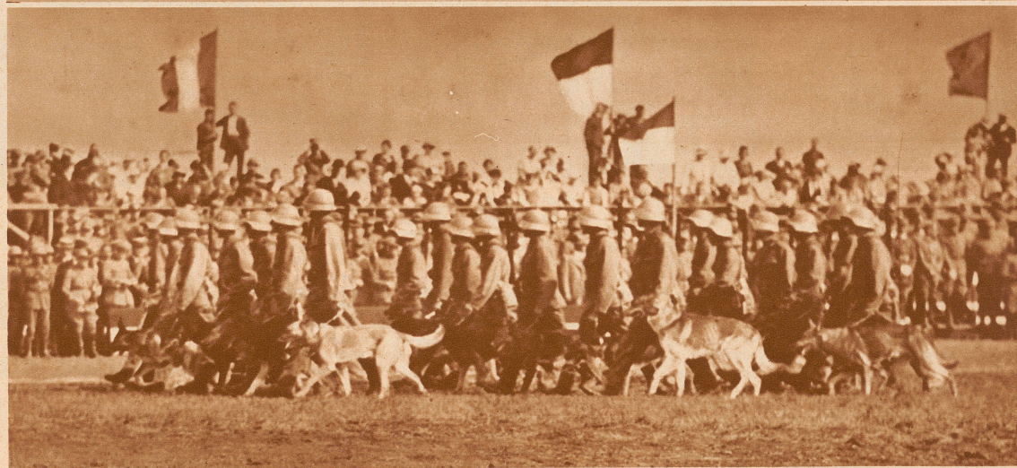
Das Detachement der Meldehunde, die Spezi- alität der zweiten Division