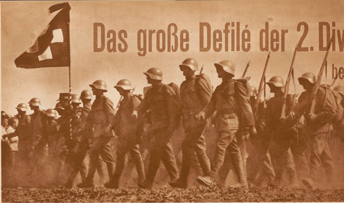
In Zwölferkolonnen defilierte in strammem Taktschritt die graue Masse der Fußtruppen. 15 Infanterie- und 3 Schützenbataillone