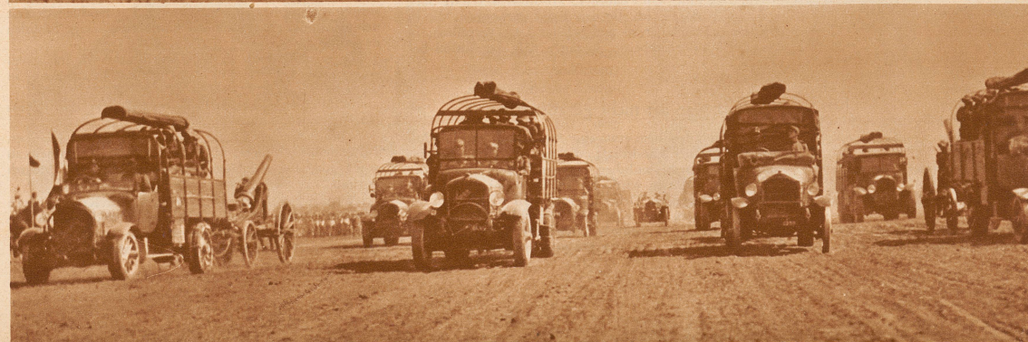
Die motorisierte schwere Artillerie