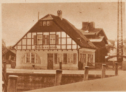
Das Stationsgebäude des aerologischen Forschungsinstitutes in Friedrichshafen mit dem Windmesserturm

Eines der ältesten aerologischen Forschungsinstitute auf dem Kontinent ist die Drachenstation in Friedrichshafen, die schon vor 25 Jahren ihre regelmäßige Tätigkeit aufgenommen hatte. Das Bestreben, in der Höhe der Atmosphäre wissenschaftliche Messungen für den Wetterdienst vorzunehmen, war zwar schon damals nicht neu, denn schon seit der Erfindung des Luftballons waren derartige Versuche immer und immer