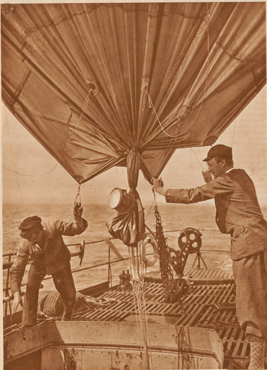
Einholen des Meßballons. Nachdem das Körbchen mit den Registrier-Apparaten vom Ballon entfernt worden ist, wird er bis zum nächsten Aufstieg in einer Versenkung des Schiffes verankert