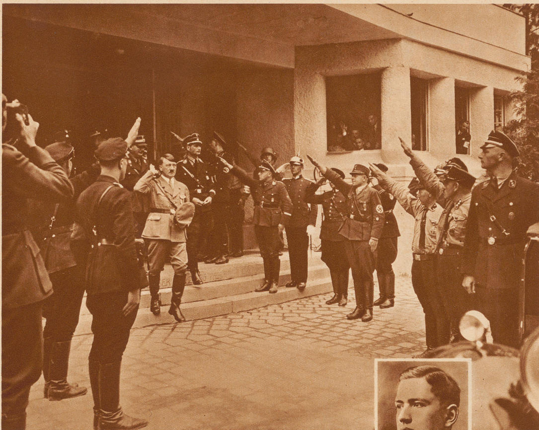
Nationalsozialistische Tagung in Nürnberg. Während des großen Treffens der deutschen Nationalsozialisten in Nürnberg hielt Hitler eine große Rede, die als wichtige partei- und staatspolitische Proklamation angesehen wird. Bild: Der Reichskanzler verläßt nach seiner Rede die Luitpoldhalle. Hinter ihm, links, der Stabchef der S. A., Röhm, rechts der Stellvertreter des Parteiführers, Rudolf Heß