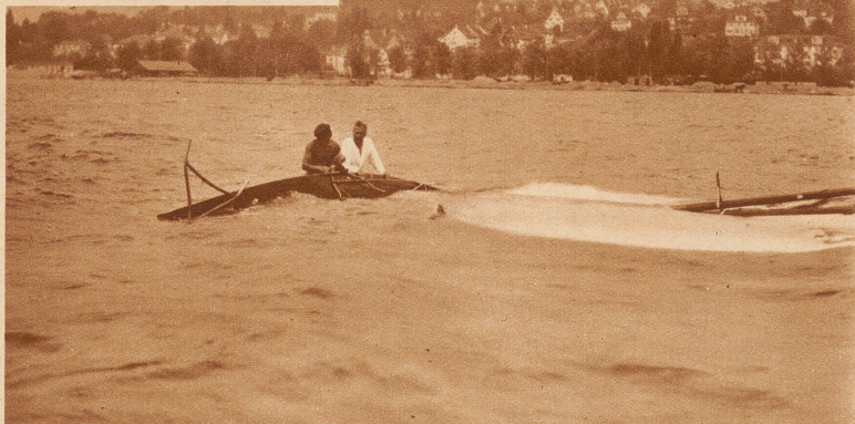
«Nelly III vom Attersee» ist gekentert. Bei der Internationalen Jollenregatta auf dem Zürichsee wurde ein schwerer Westwind dem österreichischen Boot zum Verhängnis