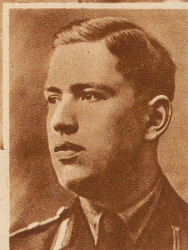
Franz Hofer , der nationalsozialistische Gauleiter des Gaues Tirol wurde von Gesinnungsfreunden gewaltsam aus dem Innsbrucker Gefängnis befreit. Er floh nach Italien und flog von dort aus nach Nürnberg, um an der Tagung seiner Partei teilnehmen zu können