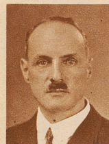
G. A. Gollier langjähriger Schweizerkonsul in Batavia, ist zurückgetreten und in die Schweiz zurückgekehrt