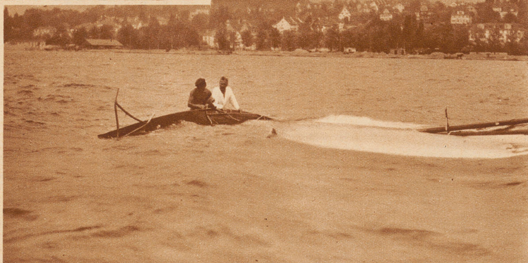
«Nelly III vom Attersee» ist gekentert. Bei der Internationalen Jollenregatta auf dem Zürichsee wurde ein schwerer Westwind dem österreichischen Boot zum Verhängnis