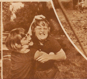
Hie Zürich — hie Genf!