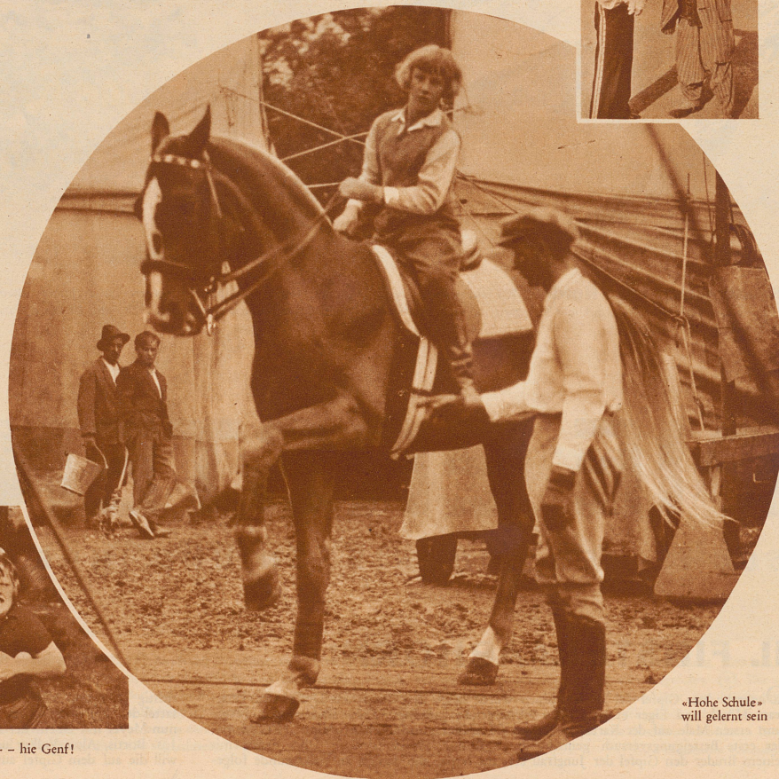
«Hohe Schule» will gelernt sein