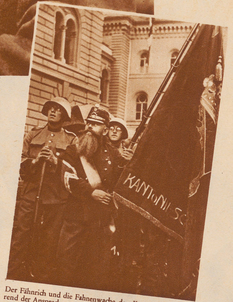
Der Fähnrich und die Fahnenwache der Kantonalen während der Ansprache von Bundesrat Minger