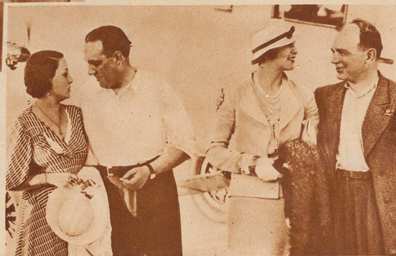
9464 Kilometer — der neue Distanz-Weltrekord. Die beiden französischen Flieger Codes und Rossi haben einen neuen Weltrekord im Nonstop-Flug in gerader Linie aufgestellt. Sie flogen in 53 Stunden von New York nach Rayak in Syrien. Die zurückgelegte Distanz beträgt 9464 Kilometer. — Die beiden Flieger mit ihren Frauen