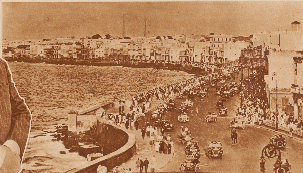
General Gerardo Machado (links) wurde im November 1924 als Kandidat der liberalen Partei zum Staatsoberhaupt der Republik Kuba gewählt. Er war seit 20. Mai 1925 ununterbrochen im Amt. Sein nationaler Ehrgeiz ließ ihn ein mächtiges Programm von «Obras públicas» (öffentlichen Arbeiten) aufstellen, allein die Durchführung seiner Pläne ging weit über die Grenzen der wirtschaftlichen Tragfähigkeit des Landes hinaus, welches sich von der furchtbaren Zuckerkrise vom Jahr 1921 noch immer nicht erholen konnte und nicht erholen konnte, solange der Zuckerpreis unter den Herstellungskosten stand und die Vereinigten Staaten, welche fast die ganze kubanische «Zafra» (Zuckerernte) aufsaugen, die Einfuhr mit einem Extrazoll von 1/10 Cent per Pfund belasten. Die innere Krisis Kubas verschärfte sich von Jahr zu Jahr. Eine fast ununterbrochene Kette von Streiks und Revolten unterdrückte Machado mit eiserner Faust. Diesmal versagte seine Macht. Er dankte ab und flüchtete im Flugzeug auf die Bahama-Inseln, während sein Palast von den Aufständischen geplündert wurde. Bild oben: Der Quai von Habana