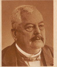
Dr. h. c. Heinrich Bolli Schaffhausen hat seinen Rücktritt aus dem Ständerat erklärt. Er gehörte der Ständekammer seit 1906 an und war 1917 bis 1918 deren Präsident