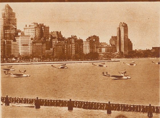
Das Balbo-Geschwader im Hafen von Chicago auf dem Michigansee

Beim Besuche der Weltausstellung in Chicago wurde General Balbo vom Stamme der Sioux-Indianer zum Häuptling mit dem Namen «Fliegender Adler» ernannt. Diese Ehre ist bis heute außer ihm nur dem verstorbenen Präsidenten Coolidge zu teil geworden. — Bild: Balbo im Kopfschmuck der Sioux neben dem Häuptling «Schwarzes Horn», der die Namensgebung vollzog