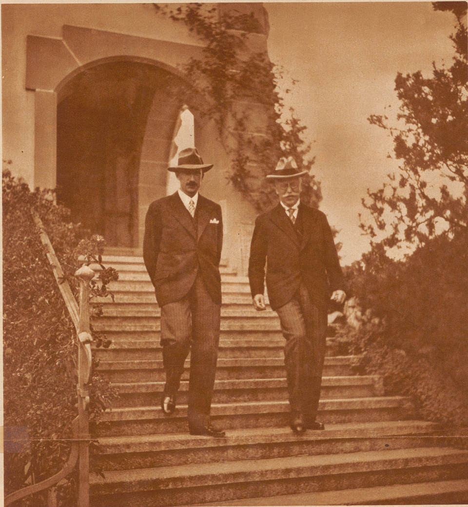
Der König von Bulgarien auf Besuch beim Bundespräsidenten. Am vergangenen Montag stattete der König von Bulgarien mit seiner Gemahlin dem schweizerischen Bundespräsidenten, der in der Kuranstalt Mammern am Untersee in den Ferien weilt, einen Besuch ab. König Boris und Bundesrat Schulthess verlassen das Hotel zu einem Spaziergang