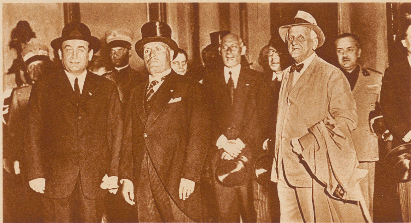
Ungarischer Besuch in Rom. Der ungarische Ministerpräsident Gömbös (ganz links) wird in Rom von Mussolini und vom ungarischen Gesandten (rechts) feierlich empfangen