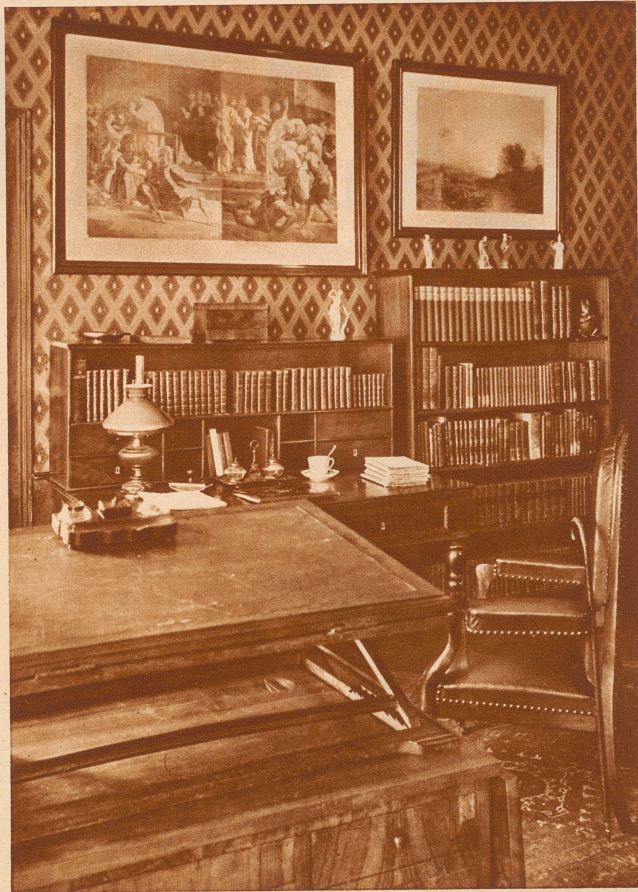
GOTTFRIED KELLERS ARBEITSZIMMER im Haus «Thaleck» am Zeltweg in Zürich