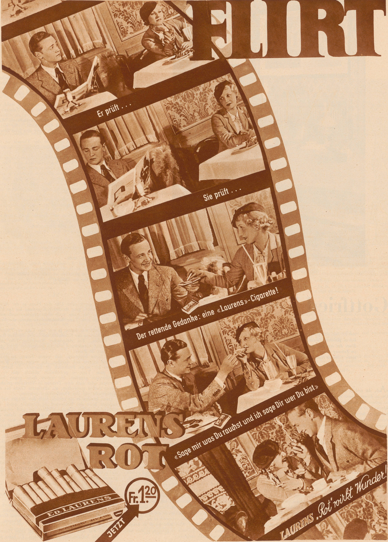
Er prüft ...