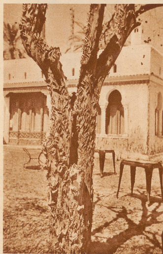
Die Heuschrecken stürmen einen alten Orangenbaum