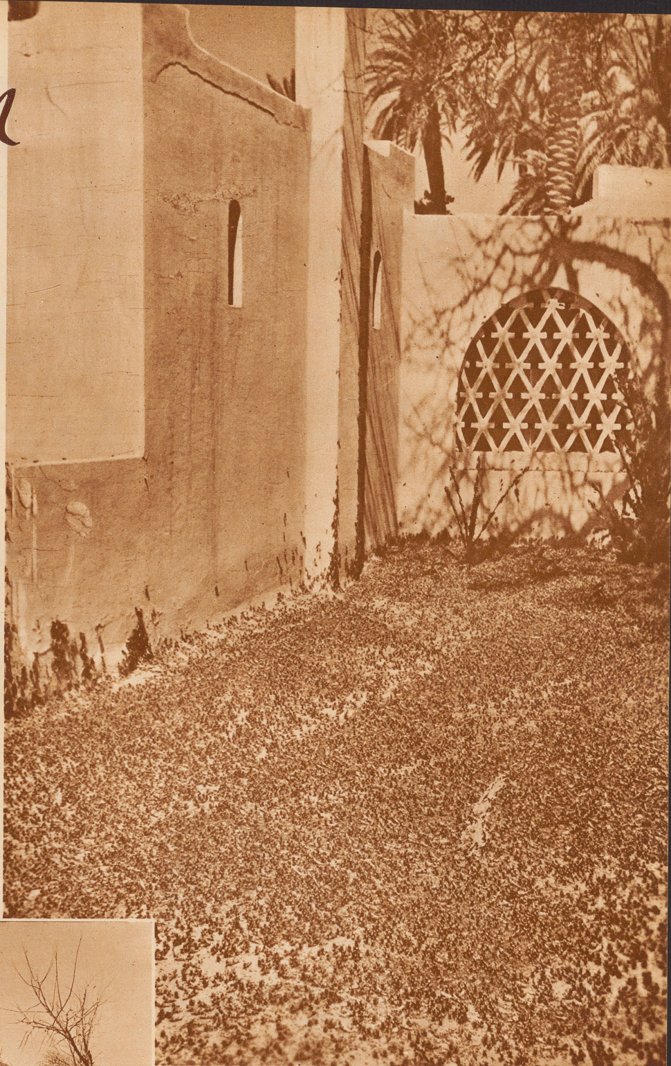
Der Hof des Transatlantique Hotels in Laghouat nach dem Heuschreckenüberfall