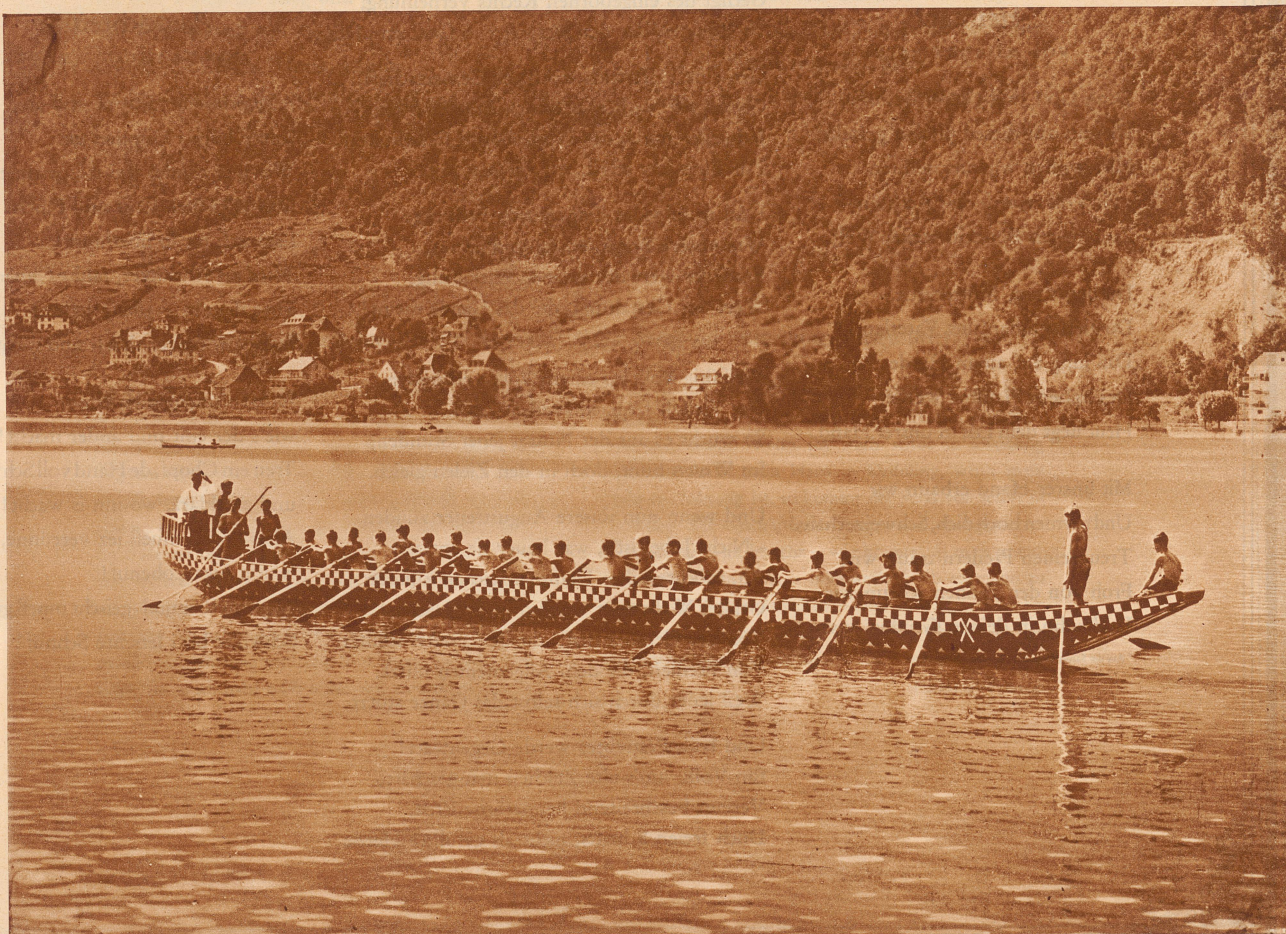
Bei uns: Die Bieler Gymnasiasten in dem neuen galeerenähnlichen Boot, das an den Ufern des Bielersees großes Aufsehen erregt. Diese Ruderstunden gehören zum Turnprogramm der Schule und stellen eine fröhliche und sinnvolle Neuerung dar