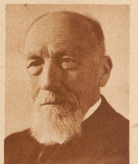
Ingenieur Emil Bürgin ein Pionier auf dem Gebiete der Elektrotechnik, starb 85jährig in Basel. In der Armee bekleidete er den Rang eines Oberstenleutnants der Genietruppen und hatte während der Grenzbesetzung die Basler Rheinbrücken in Obhut