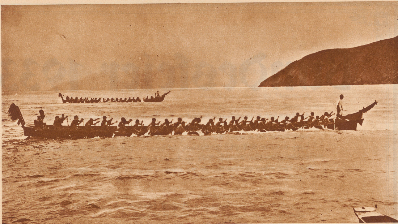
In Sumatra: Boote (genannt Sulu) auf dem Tobameer, dem größten Binnensee von Sumatra. Diese Sulus sind über 20 Meter lang und schießen pfeilschnell dahin. Vorder- und Hinterteile der Boote sind phantastisch mit Pferdeschweif und bunten Bändern verziert. Aber auch diese Sulus werden bald zur Vergangenheit gehören, sie werden verdrängt durch kleine Dampfboote, die jetzt schon den größten Verkehr regeln