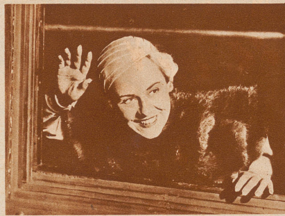
Charlie Chaplins dritte Frau: