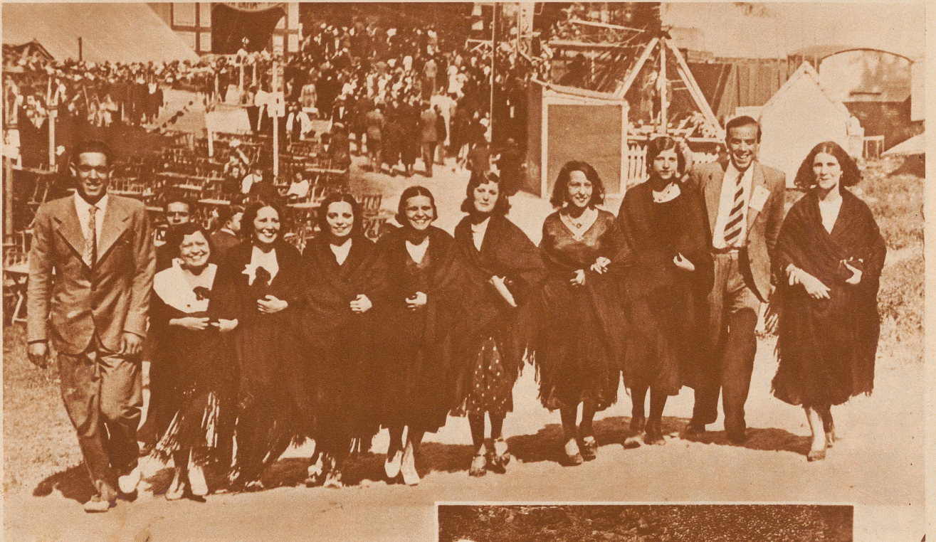
Sie bitten den Herrgott um einen Liebsten. Eines der ältesten religiösen Feste Spaniens ist der Tag des Heiligen Antonius am 14. Juni. An diesem Tag haben nach uralter Gepflogenheit jene Mädchen, die noch ungeliebt sind, das Recht, geschlossen in die Kirche zu gehen und Gott um einen Liebsten zu bitten. — Bild: Eine Gruppe junger «Madrilenas» in der landesüblichen schwarzen Mantilla auf dem Kirchgang am St. Antonstag