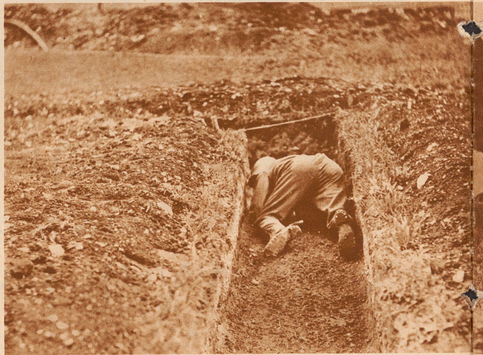
Hindernis 4: Dann muß der Mann seine Kunst im Kriechen zeigen und stellenweise eine eingestürzte Sappe von 50 cm Tiefe und 80 cm Breite mit möglicher Deckung nach vorn passieren. Der punktierende Offizier vor der Sappe, mit dem Kopf knapp über der Erde, paßt wie ein «Heftlimacher» auf, ob er von dem Kriechenden etwas sieht. Denn für jedes Sichtbarwerden wird 1 Punkt abgezogen