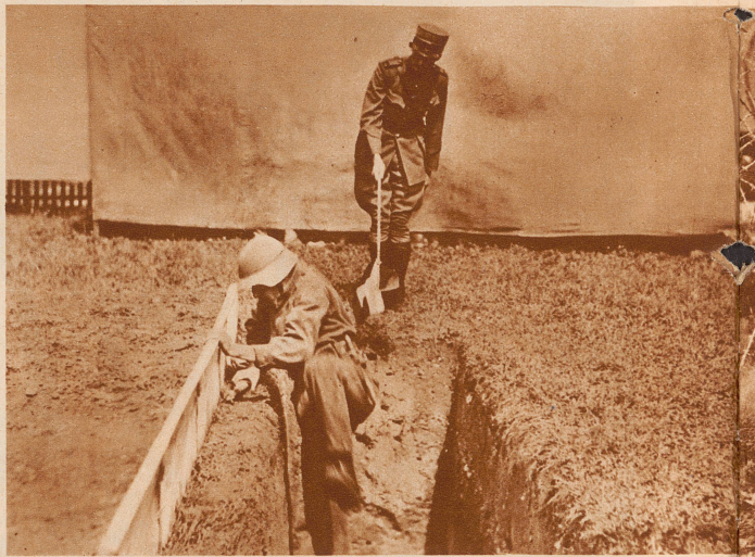
Hindernis 1: Start aus einem Schützengraben. Der Offizier mit dem Fähnchen hat soeben das Zeichen gegeben: Los!