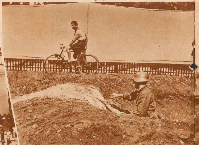
Hindernis 7: Sprung in einen Granattrichter von 3m Durchmesser und 1m Tiefe und Wurf von 3 Handgranaten auf den Zielgraben. Das Gelingen ist mehr oder weniger Glückssache, denn sofort muß sich der Mann wieder auf den Trichterboden werfen, ohne sich vom Erfolg seines Wurfs überzeugen zu können