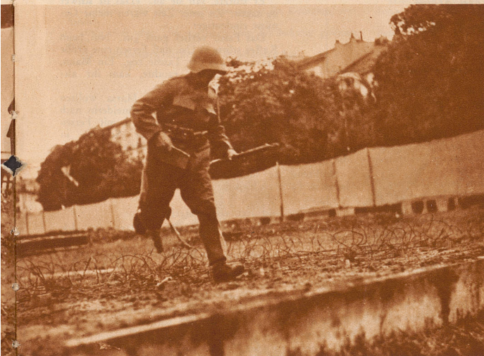
Hindernis 8: Nun droht noch eine 4 m lange, mit Fußschlingen überspannte Strecke ihn zu Fall zu bringen, ehe er .....