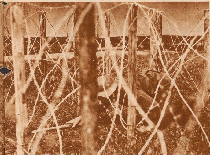
Hindernis 2: Schlüpfen durch eine Gasse in Stacheldrahtverhau. Die Unteroffiziere haben vorher alte Militärblusen gefaßt, denn ohne einige Dreieckeln geht der Durchschlupf gewöhnlich nicht ab. Dann rasch auf und .....