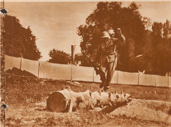
Hindernis 5: Nun zeigt sich der Prüfling als Gleichgewichtskünstler, indem er einen Wasserlauf von 5 m Breite auf einem Baumstamm überquert. Wegen des Regenwetters ist hin und wieder einer ausgeglitscht und pudelnaß .....