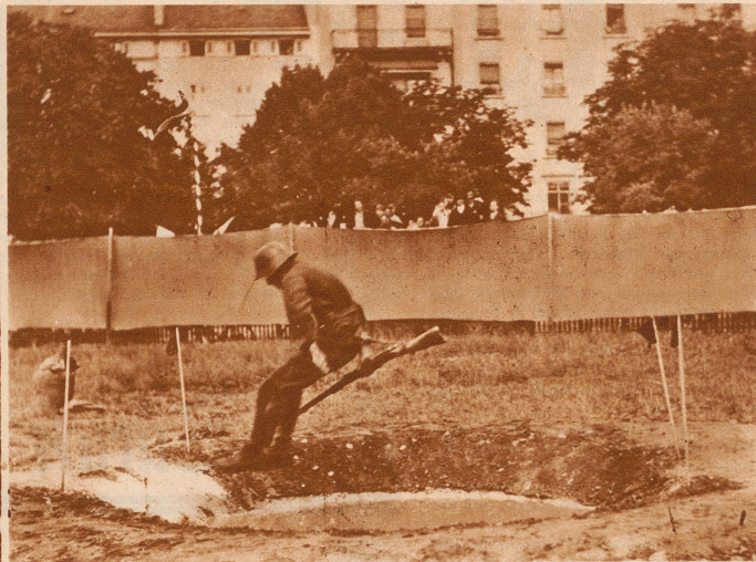
Hindernis 3: Sprung über einen mit Wasser gefüllten Granattrichter von 3 m Durchmesser. Wer das Wasser berührt, bekommt 5 Punkte Abzug