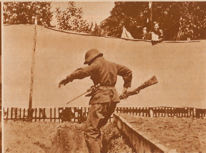
Hindernis 9: mit einem Sprung in den Zielgraben das letzte Hindernis erledigt hat