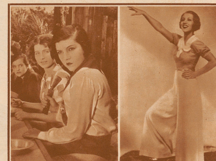
in einem ihrer ersten Filme, der «Republik der Backfische»