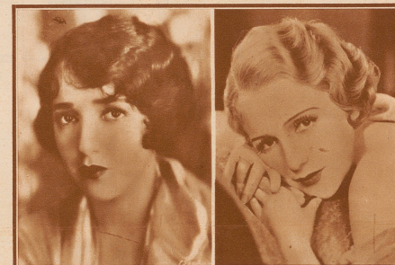
im Stummfilm: schwarz, mit breiten Augenbrauen