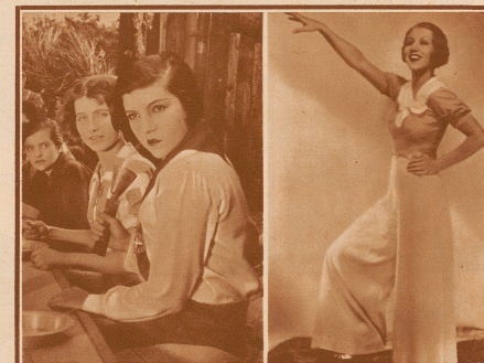
in einem ihrer ersten Filme, der «Republik der Backfische»