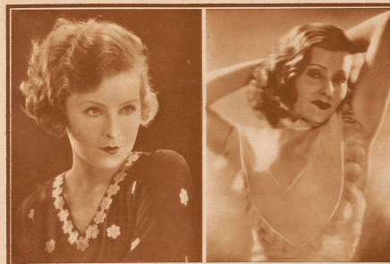
1927: in dem Eichbergfilm «Du sollst nicht stehlen», in welchem sie das junge Mädchen aus guter Familie spielte