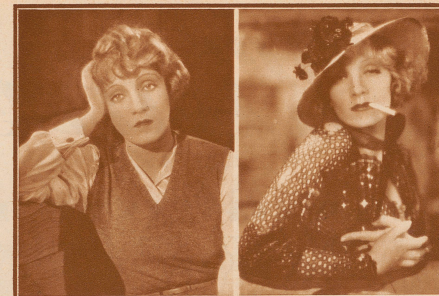
im Film: «Das Schiff der verlorenen Menschen.» Damals war sie — vor ihrem großen Erfolg im Blauen Engel — noch vollkommen unbekannt