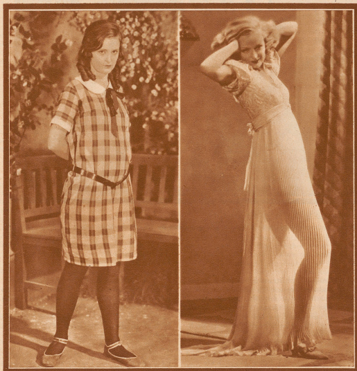
in ihrer Stummfilmzeit: «Jugendrausch»