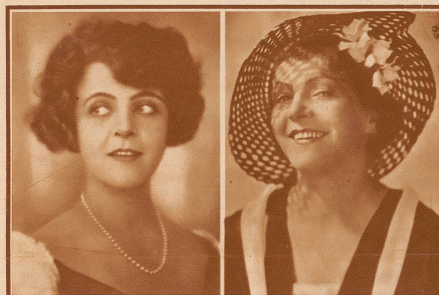
in einem Stummfilm 1926