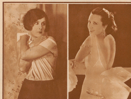
in dem Stummfilm: «Der Demütigte und die Sängerin»