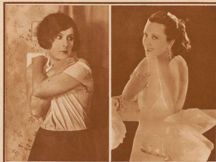
in dem Stummfilm: «Der Demütige und die Sängerin»