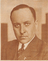
Dr. Walter Darré, der neue Reichsminister für Ernährung und Landwirtschaft, der Nachfolger Geheimrat Hugenburgs, ist der Vertrauensmann der deutschen Bauernschaft und gilt als energischer Gegner des Großgrundbesitzes

Im Kreis: Staatsratspräsident Dr. Ley wird nach seiner Rückkehr aus Genf, wo er als Chef der deutschen Delegation an der Arbeitskonferenz teilnahm, in Berlin empfangen. Dr. Ley, einer der mächtigsten Männer an der Spitze des Dritten Reiches, ist Führer der deutschen Arbeitsfront. Die Aufgabe der deutschen Arbeitsfront besteht in der Wahrnehmung und Verteidigung der Interessen der deutschen Arbeiter- und Angestelltenverbände