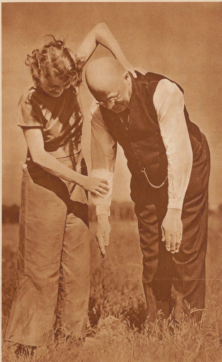
Locker, locker, Vati! Und dann runter bis auf die Fußspitzen mit den Händen! Rückenweh? Ach, nein, das ist nur der böse Anfang

Dieser deutsche Papa mit seiner sportlichen Tochter – er hat's nicht leicht, er dachte, sich's in den Ferien recht bequem zu machen und im Grünen zu liegen. Statt dessen muß er jetzt im Grünen – – turnen! Sonst bleibt sie nicht bei ihm – hat sie gesagt! Turnen; weil es zu