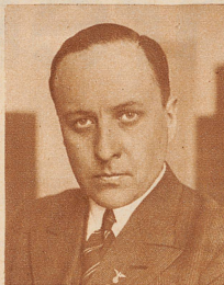
Dr. Walter Darré, der neue Reichsminister für Ernährung und Landwirtschaft, der Nachfolger Geheimrat Hugenburgs, ist der Vertrauensmann der deutschen Bauernschaft und gilt als energischer Gegner des Großgrundbesitzes

Im Kreis: Staatsratspräsident Dr. Ley wird nach seiner Rückkehr aus Genf, wo er als Chef der deutschen Delegation an der Arbeitskonferenz teilnahm, in Berlin empfangen. Dr. Ley, einer der mächtigsten Männer an der Spitze des Dritten Reiches, ist Führer der deutschen Arbeitsfront. Die Aufgabe der deutschen Arbeitsfront besteht in der Wahrnehmung und Verteidigung der Interessen der deutschen Arbeiter- und Angestelltenverbände