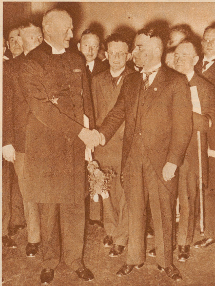
Wehrkreispfarrer Ludwig Müller (links) 50jährig. Nach dem Rücktritt von Reichsbischof Bodelschwingh gilt er als der kommende Mann in der gleichgeschalteten Kirche