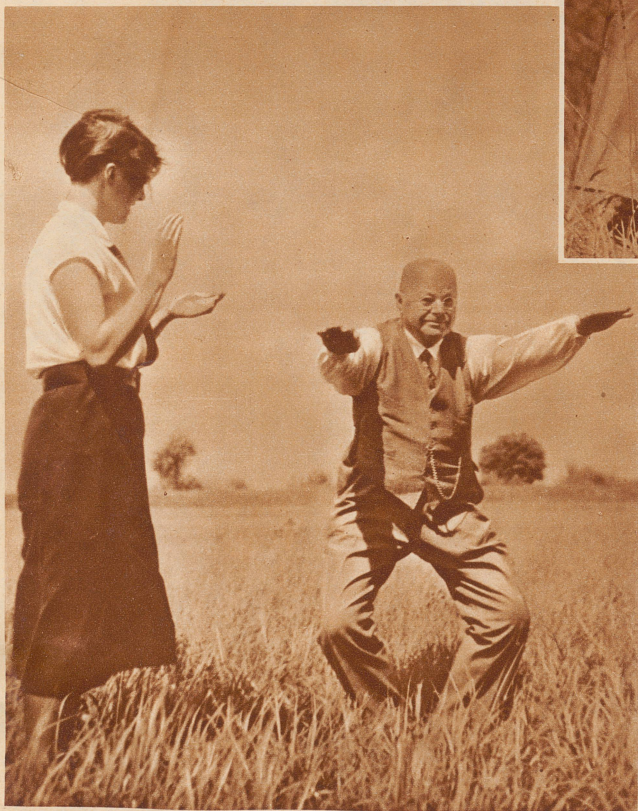
Kniebeugen – beugt! Eins-zwei-drei! – Hoch – Eins-zwei-drei! Langsam! Gut ausatmen. – Morgen geht's schon besser

seinem Besten ist, turnen gegen Arterienverkalkung, Rheumatismus, Fettansatz usw. Oh, diese modernen Töchter! Diese guten, forschen, kecken, lieben Geschöpfe! Schweizer-Väter, paßt auf, wenn ihr mit den Eurigen in die Ferien geht, denn die sportliche weibliche Jugend – sie ist ja auch bei uns ins Kraut geschossen – Gottlob!