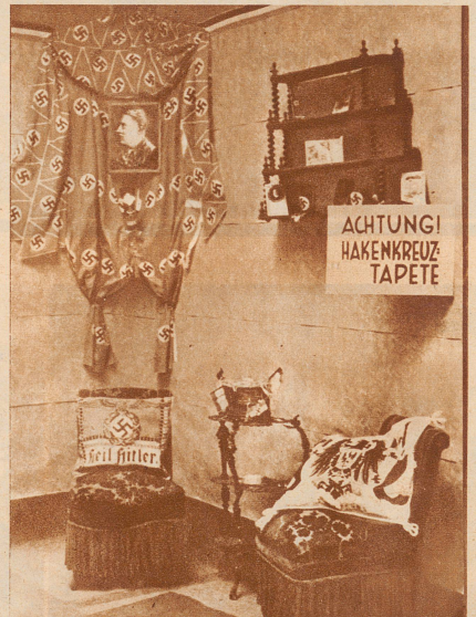
Kampf dem nationalen Kitsch. Unter dem Stichwort «Weg mit dem nationalen Kitsch» veranstaltete der Kampf Bund für deutsche Kultur vom 16.-30. Juni in Köln eine Ausstellung. Die Schau hatte den Zweck, die Regierung in ihrem Kampfe gegen den Mißbrauch der nationalen Symbole zu unterstützen. Unser Bild zeigt eine Sammlung typischer verkitschter Gegenstände, denen nun der Kampf angesagt ist