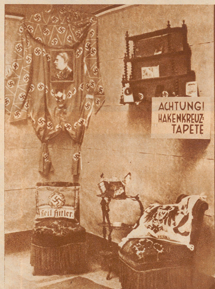
Kampf dem nationalen Kitsch. Unter dem Stichwort «Weg mit dem nationalen Kitsch» veranstaltete der Kampfbund für deutsche Kultur vom 16.-30. Juni in Köln eine Ausstellung. Die Schau hatte den Zweck, die Regierung in ihrem Kampfe gegen den Mißbrauch der nationalen Symbole zu unterstützen. Unser Bild zeigt eine Sammlung typischer verkitschter Gegenstände, denen nun der Kampf angesagt ist