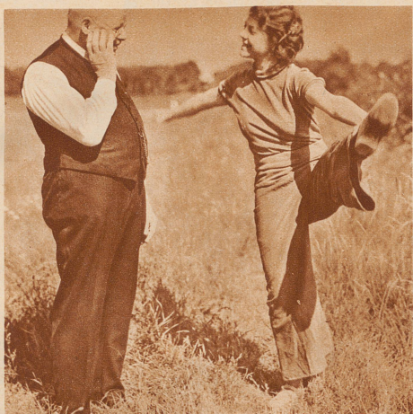
Lieber Himmel! Mädel! Das auch noch! Damit fangen wir aber lieber erst im nächsten Jahr an!

Dieser deutsche Papa mit seiner sportlichen Tochter – er hat's nicht leicht, er dachte, sich's in den Ferien recht bequem zu machen und im Grünen zu liegen. Statt dessen muß er jetzt im Grünen – – turnen! Sonst bleibt sie nicht bei ihm – hat sie gesagt! Turnen; weil es zu