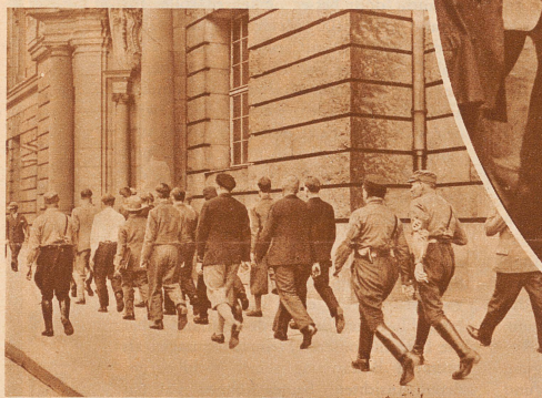
Die Deutschnationalen Kampfstaffeln aufgelöst und verboten. 30 Angehörige der Deutschnationalen Kampfstaffeln werden verhaftet und abgeführt, nachdem die Räume des Kampfzuges im Parteihaus in Berlin von den S. S. besetzt worden sind

Im Kreis: Staatsratspräsident Dr. Ley wird nach seiner Rückkehr aus Genf, wo er als Chef der deutschen Delegation an der Arbeitskonferenz teilnahm, in Berlin empfangen. Dr. Ley, einer der mächtigsten Männer an der Spitze des Dritten Reiches, ist Führer der deutschen Arbeitsfront. Die Aufgabe der deutschen Arbeitsfront besteht in der Wahrnehmung und Verteidigung der Interessen der deutschen Arbeiter- und Angestelltenverbände