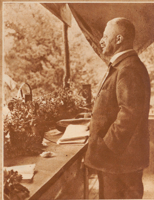
Oberstdivisionär E. Sonderegger wurde und wird zwar in Verbindung mit der «Nationalen Front», am häufigsten genannt, doch stellte er sich als Redner vielfach schon den andern Fronten und Gruppen zur Verfügung. Ueberall vertritt er die nämlichen Postulate: Gesetz gegen Aufreizung zur Revolution und gegen antimilitaristische Propaganda, gegen Mißbrauch der Presse- und Redefreiheit und gegen volksfremde Elemente