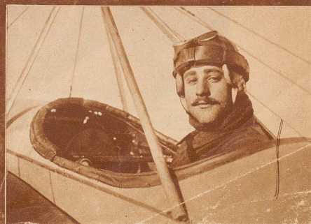
Bild oben: Ein Start in Bern um die Zeit des ersten Alpenfluges. Diese Maschine ist zur Zeit in der Ausstellung «Der Flug» in der Zürcher Tonhalle zu sehen. — Bild rechts: Oskar Bider als Flugschüler in Pau am 8. Dezember 1912, dem Tage, da er sich sein Fliegerbrevet erwarb

Am Anfang der schweizerischen Aviatik steht der Name Oskar Bider. Zwanzig Jahre sind seit dessen kühnen Vorstößen vergangen. Die vorliegende Nummer unserer Zeitung enthält auf Seiten 876/877 die interessantesten Bilder aus Biders Laufbahn.