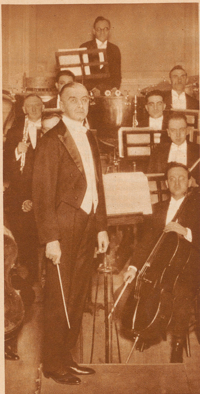
Rudolph Ganz als Dirigent des Symphonie-Orchesters in St. Louis, das unter seiner Leitung (1921 - 1927) zu einem der besten Orchester Nordamerikas sich entwickelte