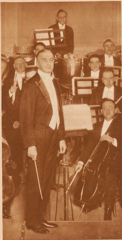
Rudolph Ganz als Dirigent des Symphonie-Orchesters in St. Louis, das unter seiner Leitung (1921 - 1927) zu einem der besten Orchester Nordamerikas sich entwickelte