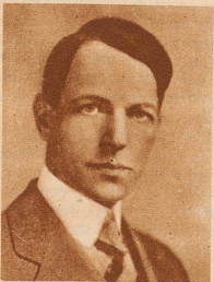
Dr. h. c. H. Ammann von Schaffhausen, der große Brückenbauer und Oberingenieur der New-Yorker Hafenbehörden