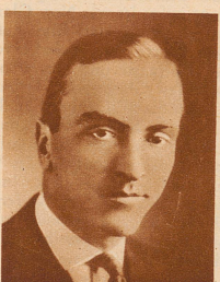
Eddie Rickenbacker aus dem Baselland, Chef der Rickenbacker-Motor-Company in Detroit und Präsident der U. S. A. Automobile-Association