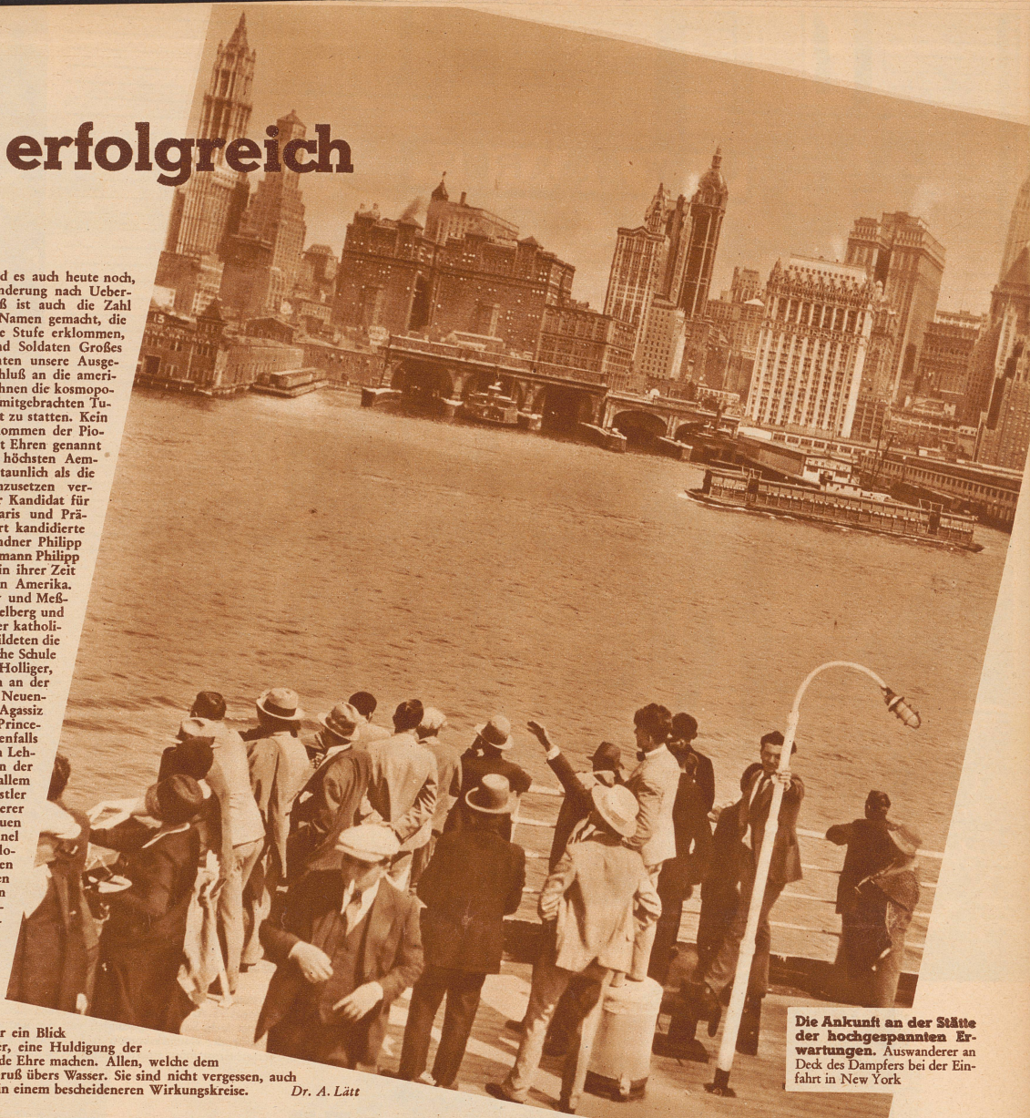
Die Ankunft an der Stätte der hochgespannten Erwartungen. Auswanderer an Deck des Dampfers bei der Einfahrt in New York