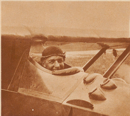
Dem Basler Max Kramer gelang am Pfingstsonntag auf dem Sportplatz Sonnenberg bei Baden mit dem Trainingsflugzeug «Kassel» ein Flug von 2 Stunden 20 Minuten. Der von W. Farner gehaltene Rekord von 1 Stunde 45 Minuten war damit gebrochen