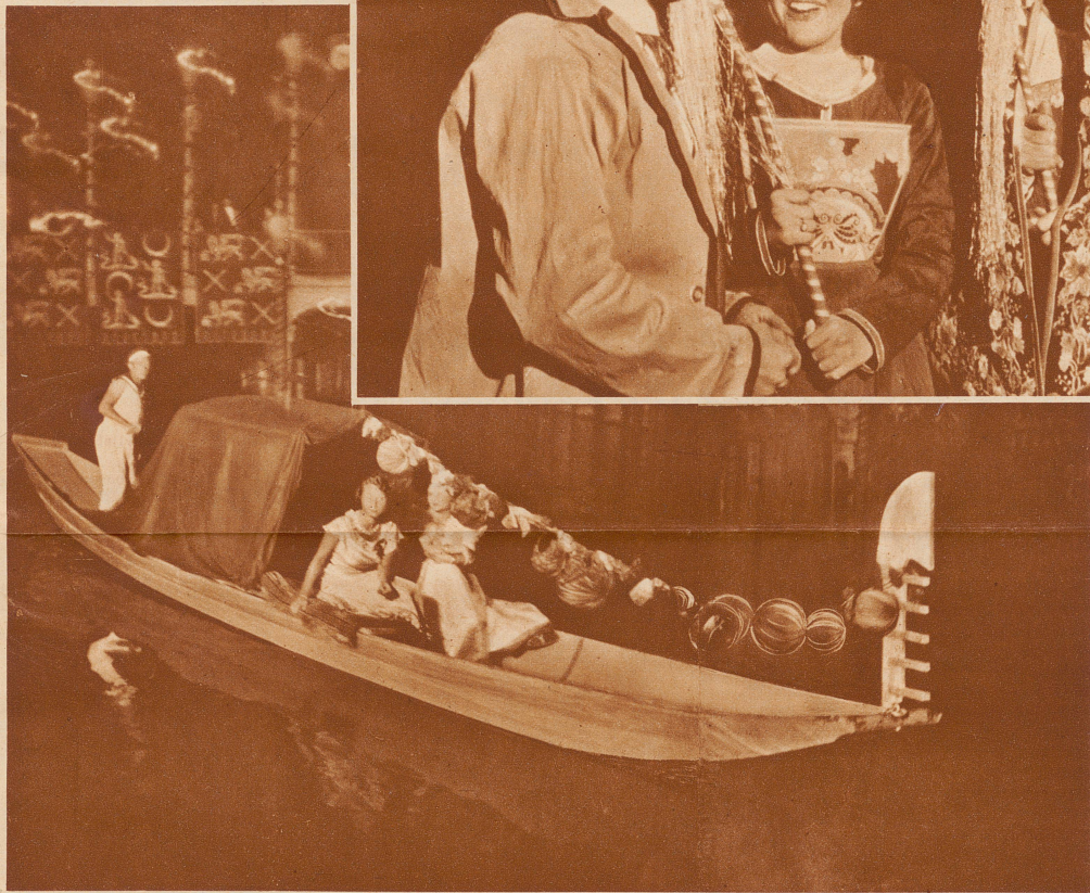
Die Gondelfahrt auf dem nächtlichen Canaletto

SOMMERNACHTS- FEST DES LESEZIRKELS HOTTINGEN