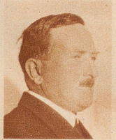
G. F. Authenrieth 1918–1929 Generaldirektor der Schweizerischen Kreditanstalt, eine hochgeschätzte Autorität in Bankfragen, starb 64jährig in Zürich