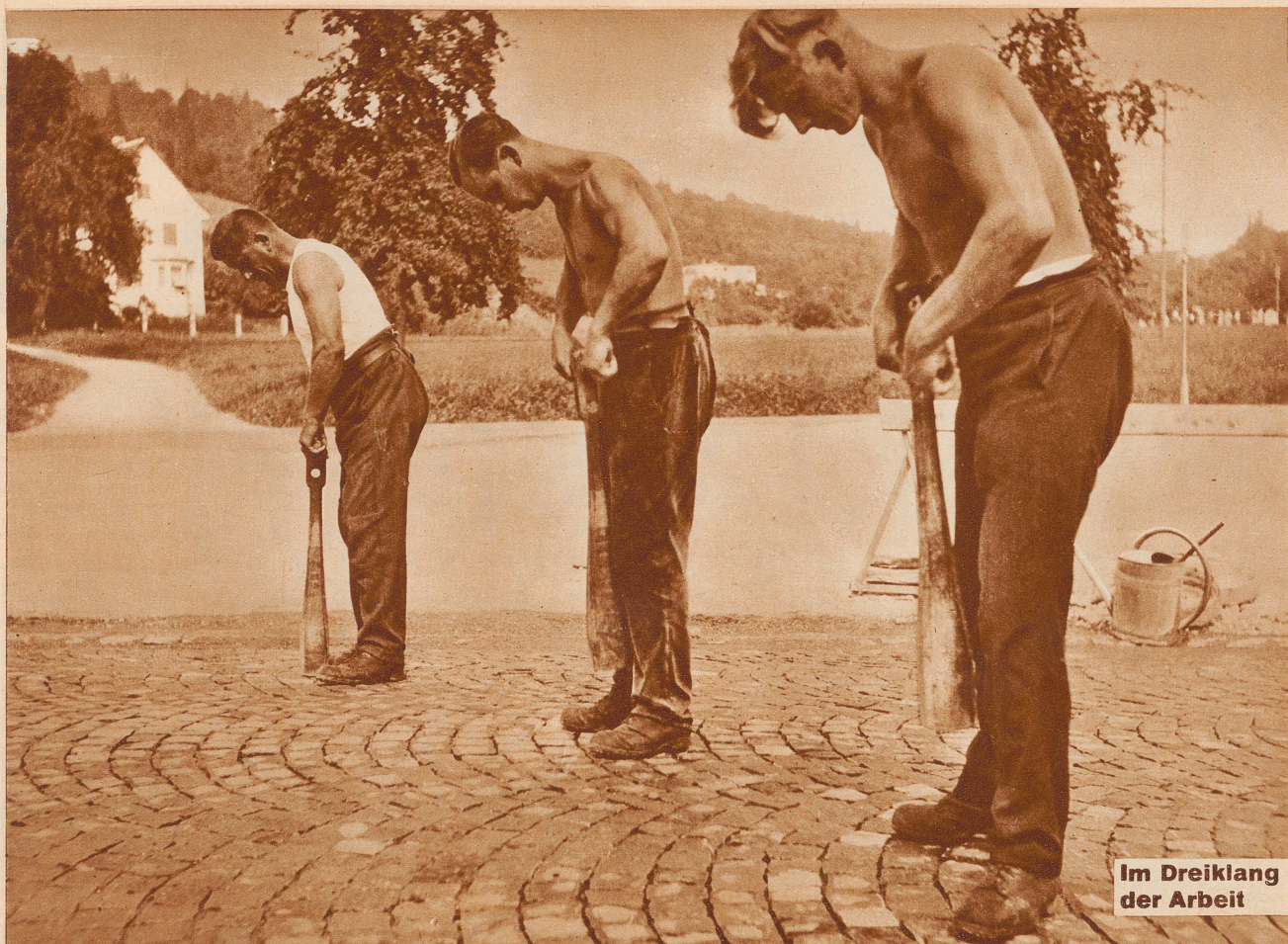
Im Dreiklang der Arbeit