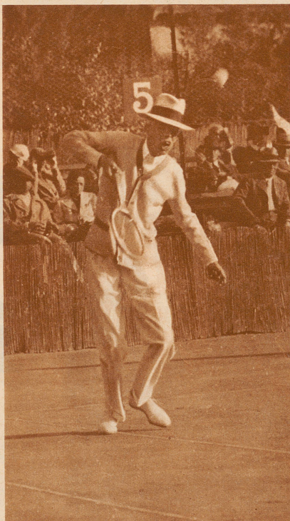
Eine typische Tennis-Haltung des Schwedenkönigs: er schaufelt den Ball gewissermaßen von unten her und «lobbt» ihn über den gegnerischen Netzspieler