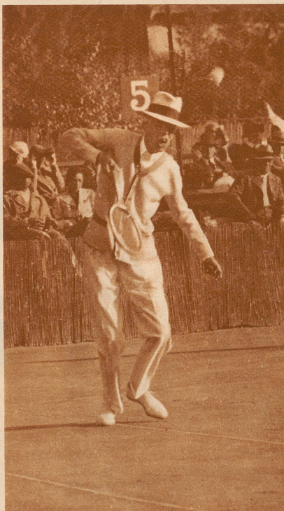
Eine typische Tennis-Haltung des Schwedenkönigs: er schaufelt den Ball gewissermaßen von unten her und «lobbt» ihn über den gegnerischen Netzspieler