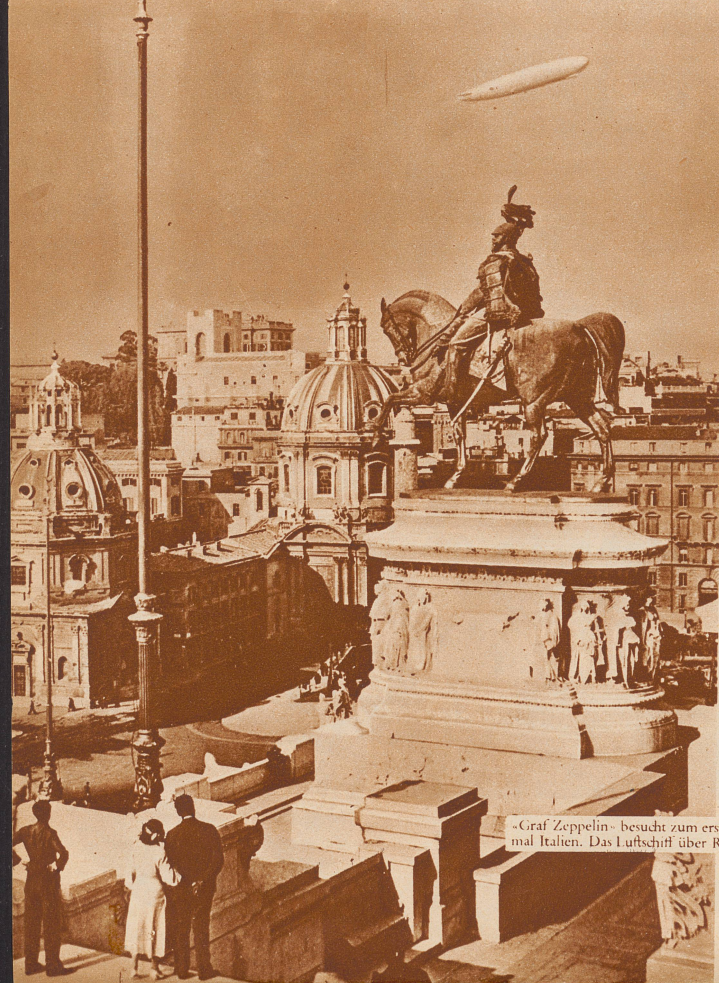
«Graf Zeppelin» besucht zum erstenmal Italien. Das Luftschiff über Rom