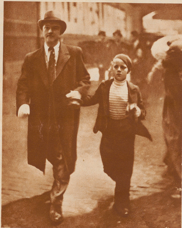
Wo ist Mutti? Sie wird begeistert gefeiert und von vielen Menschen umlagert, denn sie, die Weltberühmte, ist zum erstenmal in Paris. Ihr Mann und ihre kleine Tochter aber ziehen etwas melancholisch, Hand in Hand, von der Gare Saint Lazare aus in der Weltstadt ein. Mutti hat für sie jetzt keine Zeit, denn Mutti ist – Marlene Dietrich

ist zum ersten deutschen Reichsbischof ernannt worden