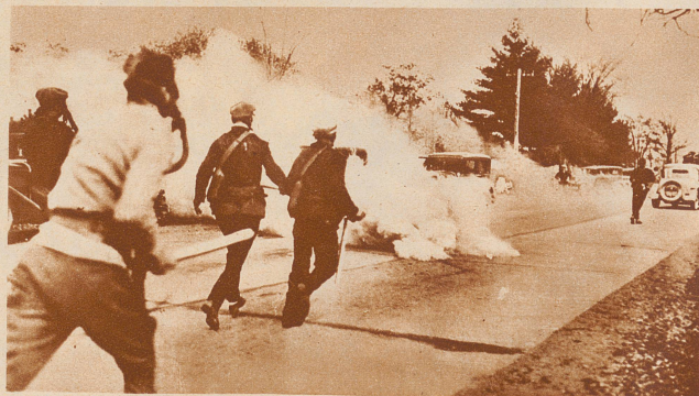
Tränengas gegen Streikende. In den Weststaaten von Nordamerika ist ein Streik in der Milchwirtschaft ausgebrochen. Im Staate Wisconsin, wo es zu heftigen Zusammenstößen zwischen Milchproduzenten und Milchkonsumenten kam, ging die Polizei mit Tränengas gegen die Streikenden vor