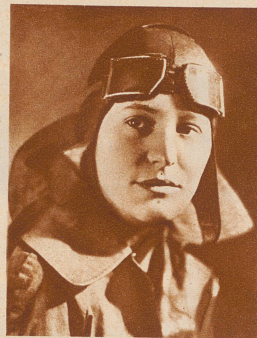
Marga von Etzdorf

die bekannte deutsche Sport- und Langstreckenfliegerin, stürzte bei einem Flug nach Australien auf dem Flugplatz von Aleppo ab und schied nachher durch Freitod aus dem Leben