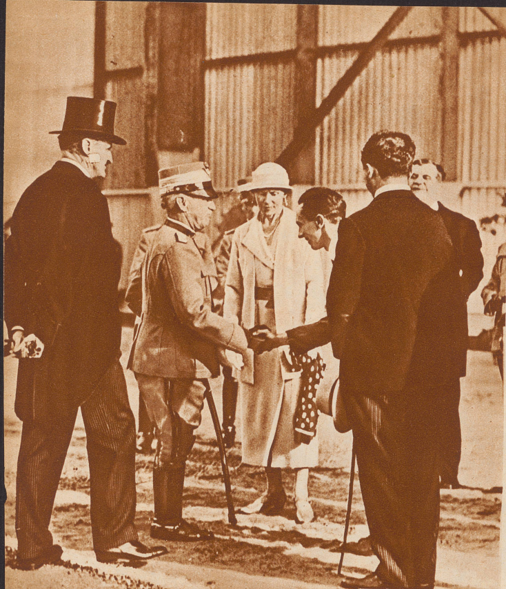
Begrüßung des deutschen Reichspropagandaministers Gobbels bei seiner Ankunft in Rom durch den König von Italien. Links der deutsche Botschafter von Hassel