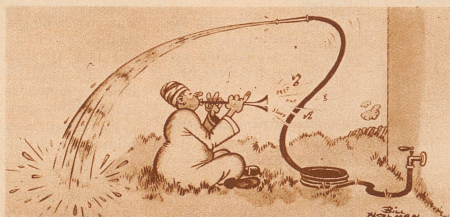
Der Cowboy und der Schlangenbeschwörer, beide spritzen ihren Garten