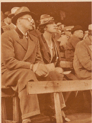
Auf der Tribüne

Der Favorit enttäuscht. Das wertlose Wett-Ticket. Der Favorit war eine Niete. Er hatte zwar Temperament genug, fand aber nicht den richtigen Einlauf zum Finish