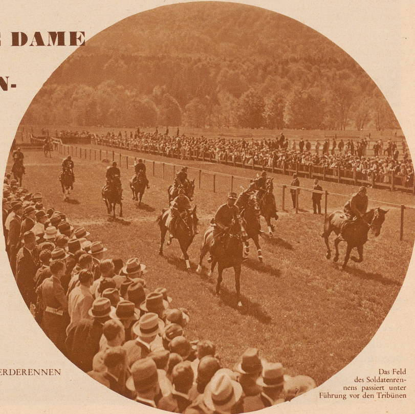
AUFNAHMEN VON DEN ZÜRCHER PFERDERENNEN