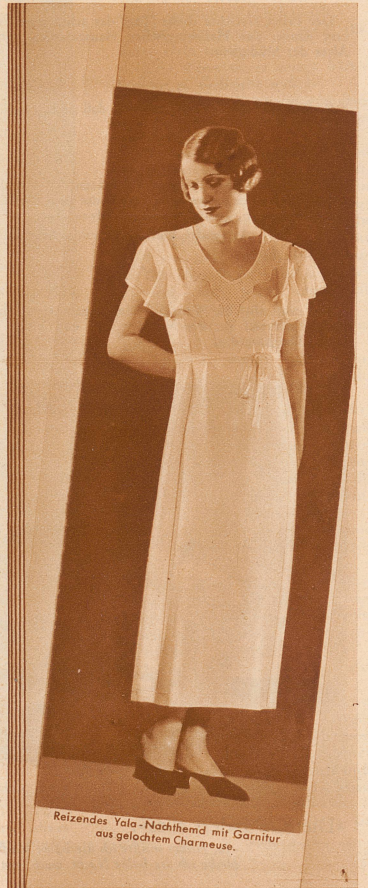
Reizendes Yala-Nachthemd mit Garnitur aus gelochtem Charmeuse.

Yala TRICOTWÄSCHE Der Inbegriff der Qualität!