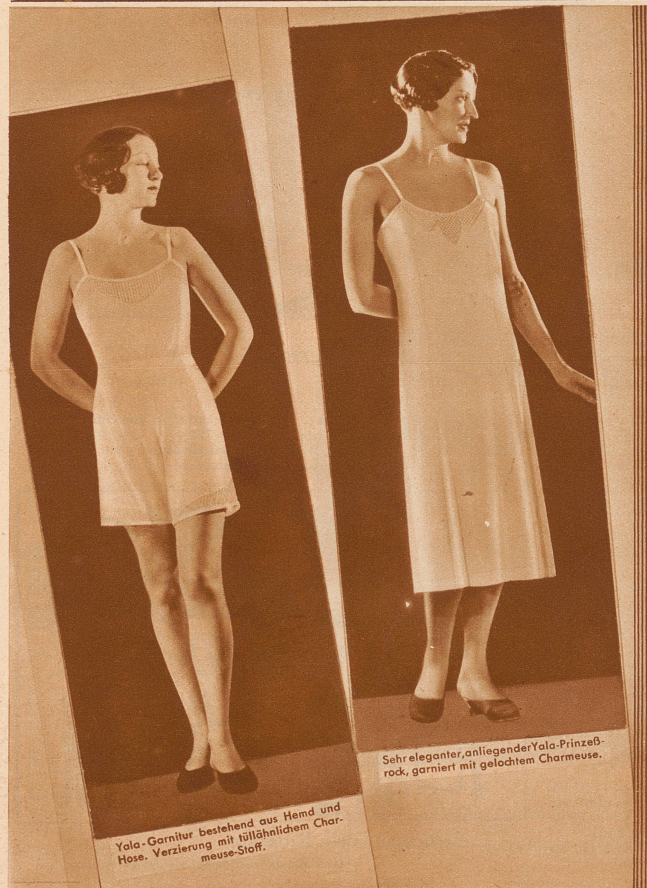
Yala-Garnitur bestehend aus Hemd und Hose. Verzierung mit tüllähnlichem Charmeuse-Stoff.