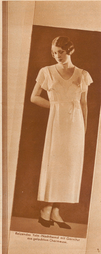
Reizendes Yala-Nachthemd mit Garnitur aus gelochtem Charmeuse.

Yala TRICOTWÄSCHE Der Inbegriff der Qualität!