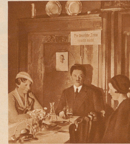
In der Stadt Ulm an der Donau hat der Staatskommissar sämtliche Gaststätteninhaber ersucht, in ihren Lokalen Plakate mit der Aufschrift: 'Die deutsche Frau raucht nicht an gut sichtbarer Stelle anzubringen'