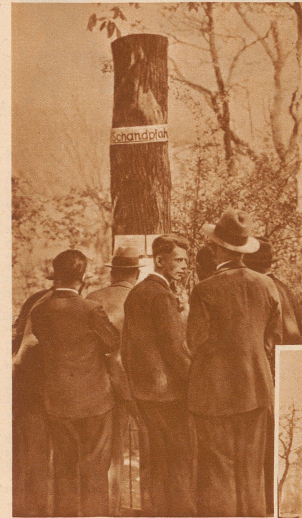
Die Studenten der Technischen Hochschule in Dresden haben innerhalb der Grünanlagen einen Schandpfahl in Form eines Baumstammes errichtet, an dem Namen von Professoren oder Studenten angeschlagen werden, die sich gegen den Geist der nationalen Revolution vergangen haben