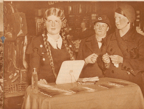
Verkäuferin in einem Berliner Kaufhaus - Abteilung Schönheitspflege. Der Verkaufstisch liegt voll Spannen, die für die Gretchenfrisur notwendig sind. Die Gretchenfrisur erfreut sich steigender Beliebtheit