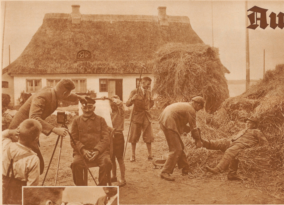
Das anthropologische Institut der Kieler Universität unternahm Forschungskursionen in norddeutsche Dörfer. Anthropologische Messungen sollen die Unterlagen liefern, deren Bearbeitung das äußere Bild der deutschen Stämme klarlegen hilft. Bild oben: Menschenmessungen auf der Dorfstraße. Die Maße der Füße sind nicht weniger wichtig, als jene des Kopfes. Also: Stiefel aus!