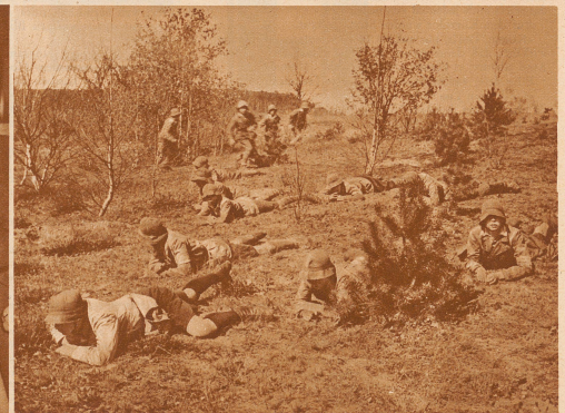
Deutsche Jungen werden nach den Richtlinien des Reichskuratoriums für Jugendertüchtigung im Geländesport ausgebildet