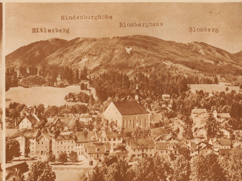
Die beiden 1200 m hohen Wärdzeichen des Jarwinkels beim Bad Tölz, der Wackerberger Berg und der Heiligkopf, sind in Hinderburghöhe und Hitlerberg umgerannt worden. Auf dem Hitlerberg soll ein 10 m hohes eisernes Hakenkreuz mit einer Widmung errichtet werden. Wie es heißt, werden bei der Umbenennungsfest der Berge Reichskanzler Hitler und die gesamte bayerische Regierung anwesend sein Aufnahme Atlantic