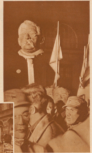
In dem Fackelzug der Studentenschaft anlässlich der Verbrennung un deutscher Bücher auf dem Berliner Opernplatz wurde die Büste des Sexualforschers Dr. Magnus Hirschfeld mitgeführt