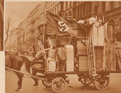
Ein Nationalsozialist wechselt seine Wohnung