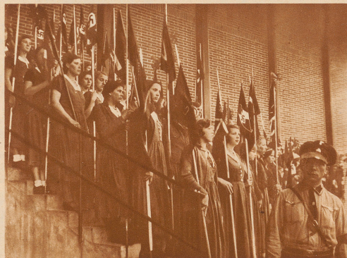
Standartenträgerinnen beim großen südwestdeutschen Gebietstreffen der Hitler-Jugend in Karlsruhe am 7. Mai 1935 Aufnahme A. P.