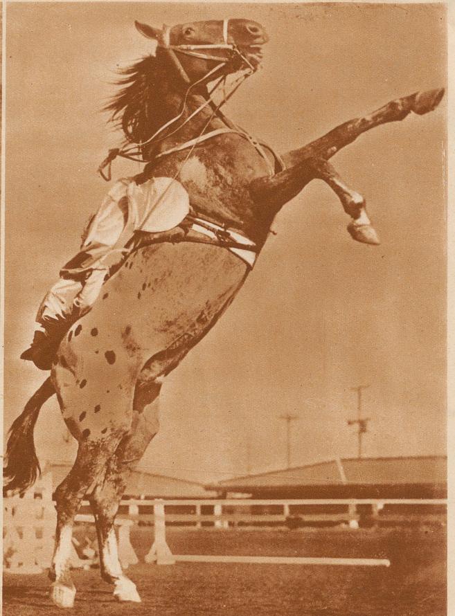
Vorführung einer amerikanischen Kunstreiterin bei einer Konkurrenz in Los Angeles