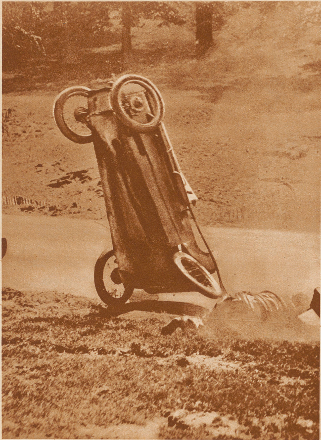
Zwischenfall bei einem englischen Autorennen an einer scharfen Kurve. Rechts neben dem Wagen der herausgeschleuderte Fahrer, der mit dem Leben davonkam