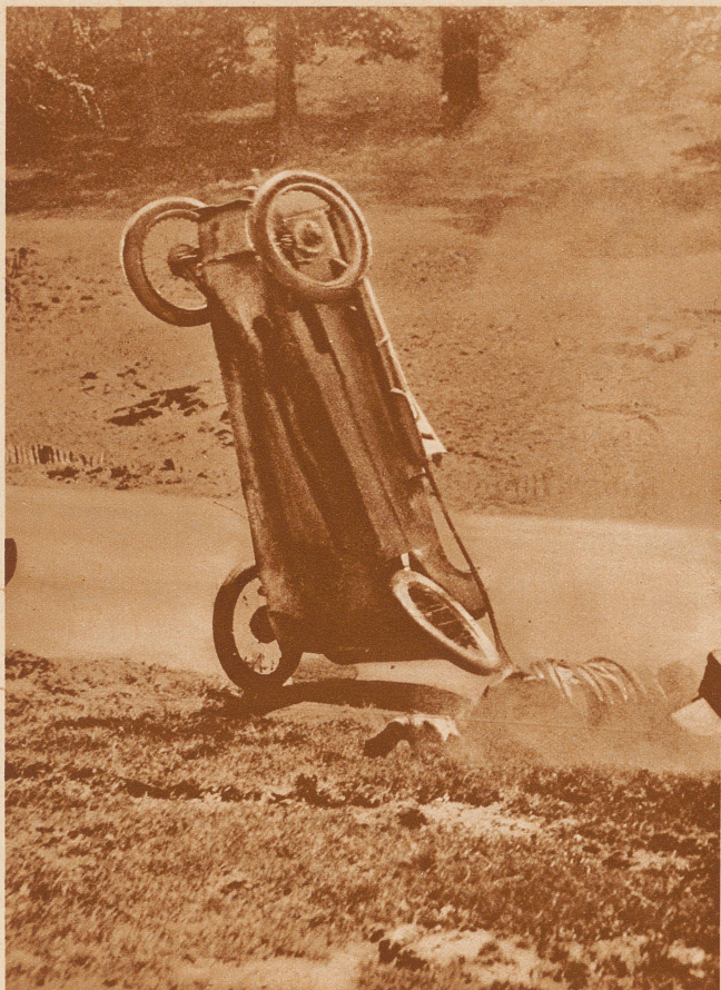
Zwischenfall bei einem englischen Autorennen an einer scharfen Kurve. Rechts neben dem Wagen der herausgeschleuderte Fahrer, der mit dem Leben davonkam