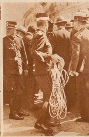
Zum Augenschein an den Oertlichkeiten der Unruhen vom 9. November 1932 rückte die Genfer Stadtpolizei mit Seilen für den Absperrungsdienst auf