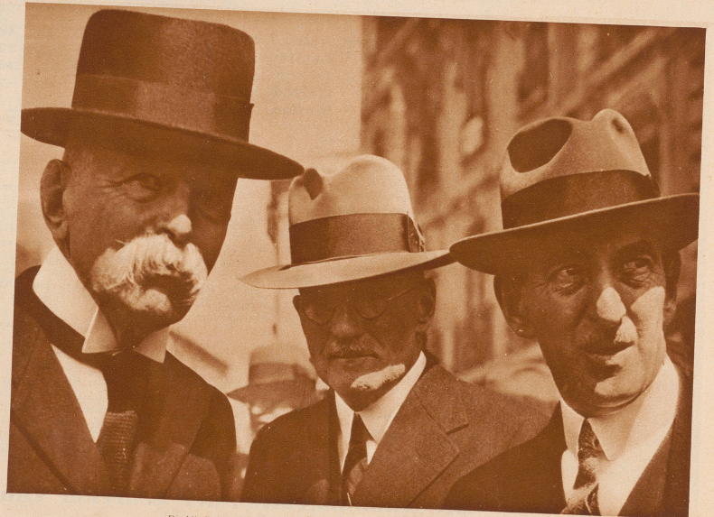
Die Mitglieder des eidgenössischen Kriminalgerichtshofes. Von links nach rechts: der 77-jährige Präsident Bundesrichter Soldati, Bundesrichter Kirchhofer und Bundesrichter Cues