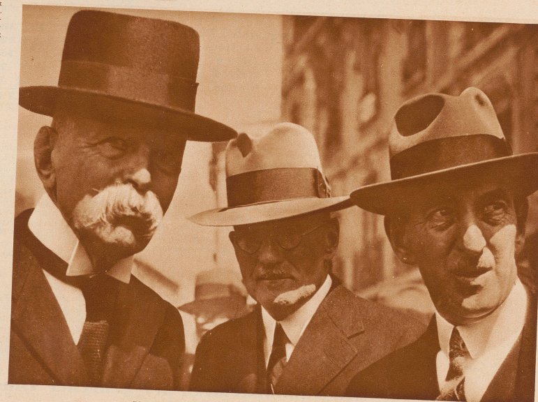
Die Mitglieder des eidgenössischen Kriminalgerichtshofes. Von links nach rechts: der 77-jährige Präsident Bundesrichter Soldati, Bundesrichter Kirchhofer und Bundesrichter Gues