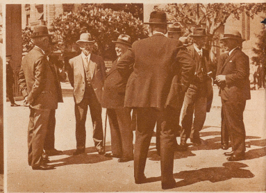
Die eidgenössischen Geschworenen bei der Versammlung zum Augenschein