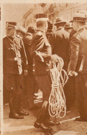
Zum Augenschein an den Oertlichkeiten der Unruhen vom 9. November 1932 rückte die Genfer Stadtpolizei mit Seilen für den Absperrungsdienst auf