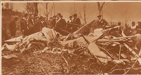
Die Ueberreste von Hinklers Flugzeug. Hoher Schnee in dem unwegsamem Gelände hatte die Auffindung bis jetzt verzögert