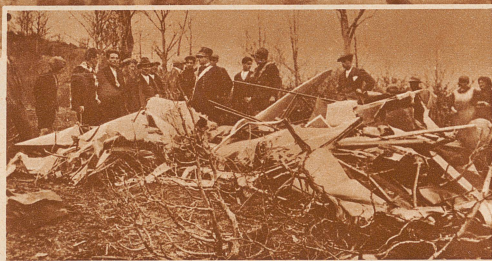
Die Ueberreste von Hinklers Flugzeug. Hoher Schnee in dem unwegsamem Gelände hatte die Auffindung bis jetzt verzögert