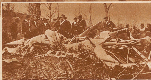
Die Ueberreste von Hinklers Flugzeug. Hoher Schnee in dem unwegsamen Gelände hatte die Auffindung bis jetzt verzögert