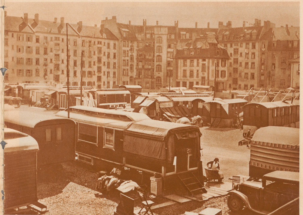
Einer der Winterstandplätze der Artisten in Zürich. Hierher kommen in den ersten kalten Herbsttagen die kleinen Bubenbesitzer und Schausteller mit ihren Wohnwagen, mit Frau und Kind und halten, — ohne feste Beschäftigung und auch ohne Einnahmen, — ihren Winterschlaf

Man muß hier unterscheiden zwischen Schaustellern und Artisten, — zwischen Unternehmern und Angestellten. Die Artisten nämlich, die nichts besitzen als ihre Arbeit, ihre «Nummern», scheiden mit dem Ende der Saison aus und suchen den Winter in kleinen Engagements, in Cafés, Variétés, Restaurants hinzubringen. Die Schausteller selbst aber haben, — wenn sie nicht von Not getrieben irgendeine Arbeit suchen müssen, — keinen Winterberuf: sie ziehen sich gemeinsam zurück und halten Winterschlaf. Für die Artisten-Unternehmer der deutschen Schweiz ist Zürich das Winterquartier. Hier mieten sie mehrere Standplätze, kommen mit den ersten Regengüssen von allen Seiten angefahren, mit ihren Wohnwagen, mit Frau und Kind und — sind für einige Monate für die Allgemeinheit verschwunden. Ihre Arbeiter — Schreiner, Anstreicher, Mechaniker — sind nur für die Saison engagiert gewesen; die größeren Betriebe behalten einige für die Durchführung der vielen Reparaturen, die anderen gehen heim, zu ihren Frauen und Kindern und leben von dem, was sie im Sommer gespart haben. Im nächsten Frühling finden sie dann meistens ihre alte Arbeit wieder vor. Die Schausteller selbst sind für die Wintermonate ebenfalls auf ihre Ersparnisse aus der fetten Saison angewiesen; was der Sommer aber regnerisch und kühl, — das Schlimmste, was Artisten passieren kann —, und wenig ertragreich, dann wird eben ein Ueberbrückungskredit aufgenommen. Es ist ja heutzutage nicht mehr so, daß