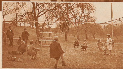
Vater und Sohn beim Wintertraining

In den letzten Tagen und Wochen sind die Artisten aus ihren Winterquartieren hervorgekommen und schwärmen nun wie die Maikäfer nach allen Windrichtungen aus. Sie dürfen auf eine gute Saison hoffen, denn ihr freudenspendendes Gewerbe ist fast so krisenfest wie dasjenige der Bäcker und Mülhändler: Amüsement muß eben sein!