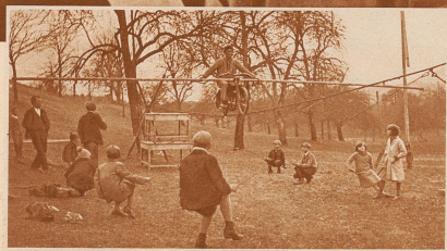
Vater und Sohn beim Wintertraining