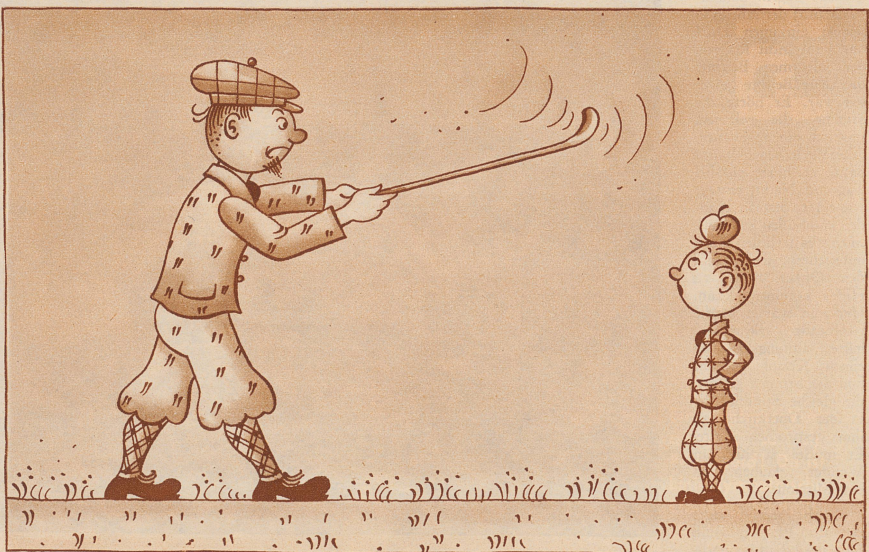
«Wenn Wilhelm Tell ein Amerikaner gewesen wäre!»

«Ich bekomme seit einiger Zeit ständig Drohbriefe übersandt! Gibt es denn kein Mittel, sich dagegen zu wehren?» «Das ist eine sehr ernste Angelegenheit! Haben Sie denn irgendeinen Verdacht, wer die Briefe geschrieben haben könnte?» «Selbstverständlich — das Möbelabzahlungsgeschäft Krause!»