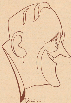
Franklin D. Roosevelt, der Präsident von U. S. A., wie der Karikaturist Lips ihn sieht