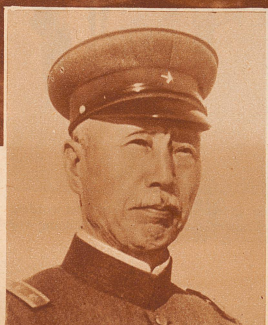
Generalleutnant Nobuyoshi Muto, der Kommandant der japanischen Streitkräfte im Kriege gegen China