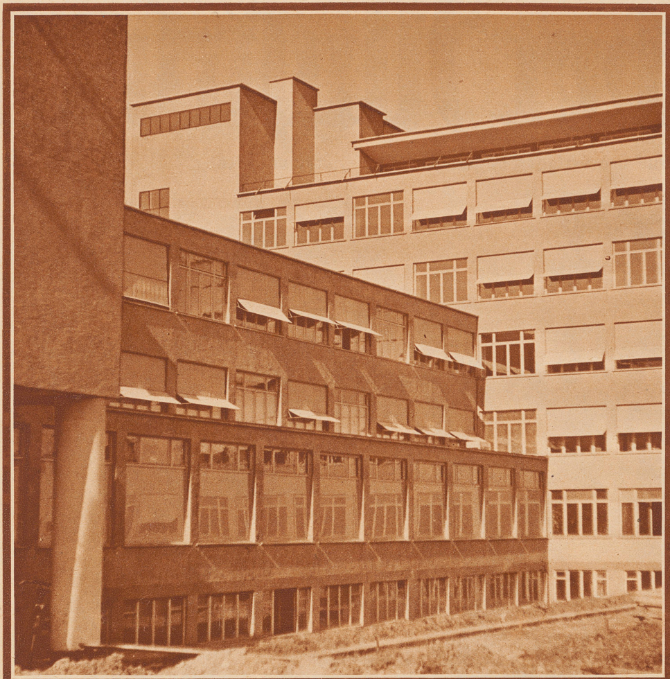
Das neue Gewerbeschulhaus in Zürich , dessen Eröffnung am 22. April feierlich stattfinden wird. Das Haus ist ein riesiger, von Architekt Egender entworfener Eisenbetonbau, der 6\frac{1}{2} Millionen Franken gekostet hat. Der Schultrakt mit über 50 Zimmer und 28 Werkstätten ist 102 Meter lang