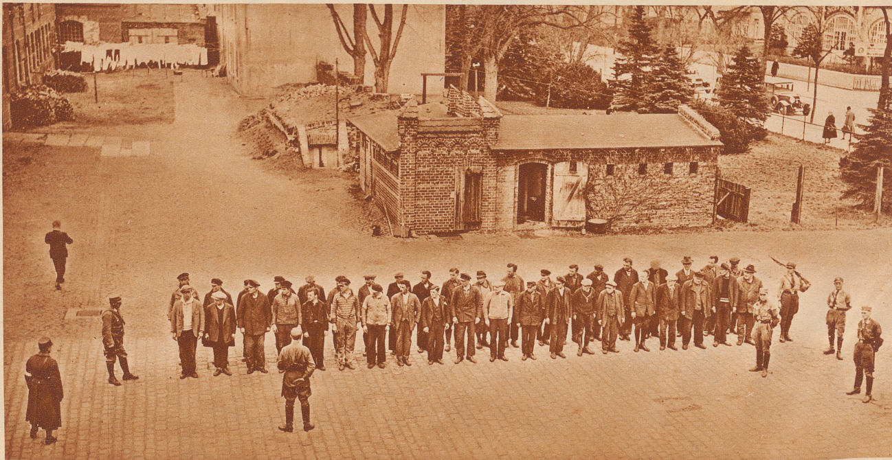
Morgenappell im Konzentrationslager. Im ganzen Deutschen Reich sind zur Unterbringung von Schutzhäftlingen und politisch verdächtigen Personen mehrere große Sammellager errichtet worden. Unser Bild zeigt einen Appell im Hofe des Sammellagers von Oranienburg an der Havel. Neben dem Arbeitsdienst sieht die Dienstordnung dieser Lager auch Exerzieren und sportliche Betätigung vor