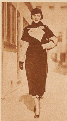
Vom kleinen Reklame-Modell zum großen Filmstar, Margaret Mc Gonnell, der neue Star der Metro-Goldwyn-Mayer, die vor kurzem noch schlecht-bezahltes Modell für Zahnpasta- und Mode-Inserate war