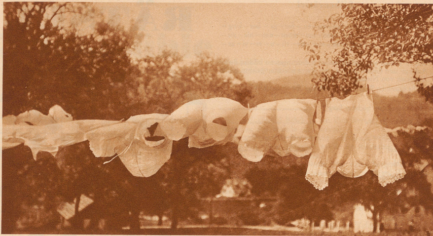
Einer unserer Abonnenten in Hollywood schickt uns dieses Bild mit folgender Unterschrift: «Marlene Dietrich hat große Wäsche»

«Märchen für groß und klein, aber es ist kein Märchen drin, das ich meiner Frau erzählen kann, wenn ich spät heimkomme.»