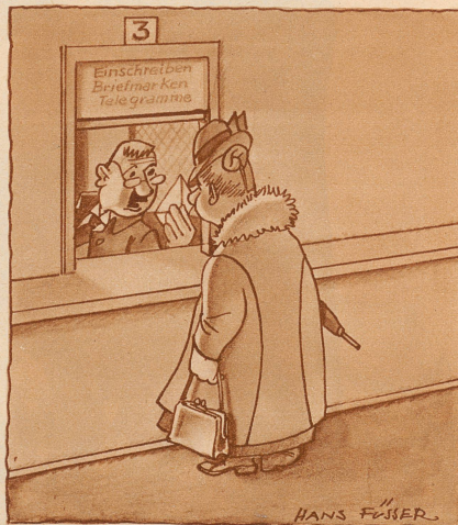
«Der Brief ist zu schwer, es muß eine andere Marke drauf!» «Wie? Wird er denn davon leichter?»

«Ach, lieber Freund», strahlte Fräulein Nelly, «ich bin ganz verliebt in mein Auto!» «Ja, ja», seufzte schmerzlich der Verehrer, «der Mann wird eben immer mehr von der Maschine verdrängt!»