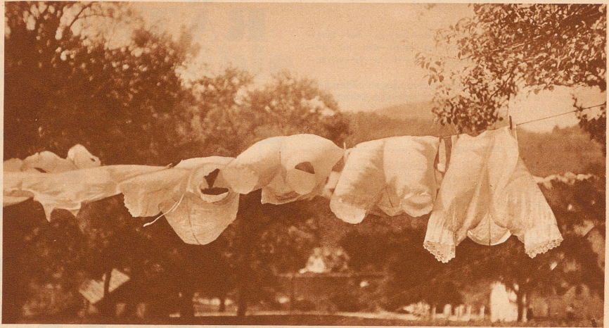
Einer unserer Abonnenten in Hollywood schickt uns dieses Bild mit folgender Unterschrift: «Marlene Dietrich hat große Wäsche»

«Ich habe eine Ohrfeige bekommen.» «Von wem?» «Von der barmherzigen Schwester.»