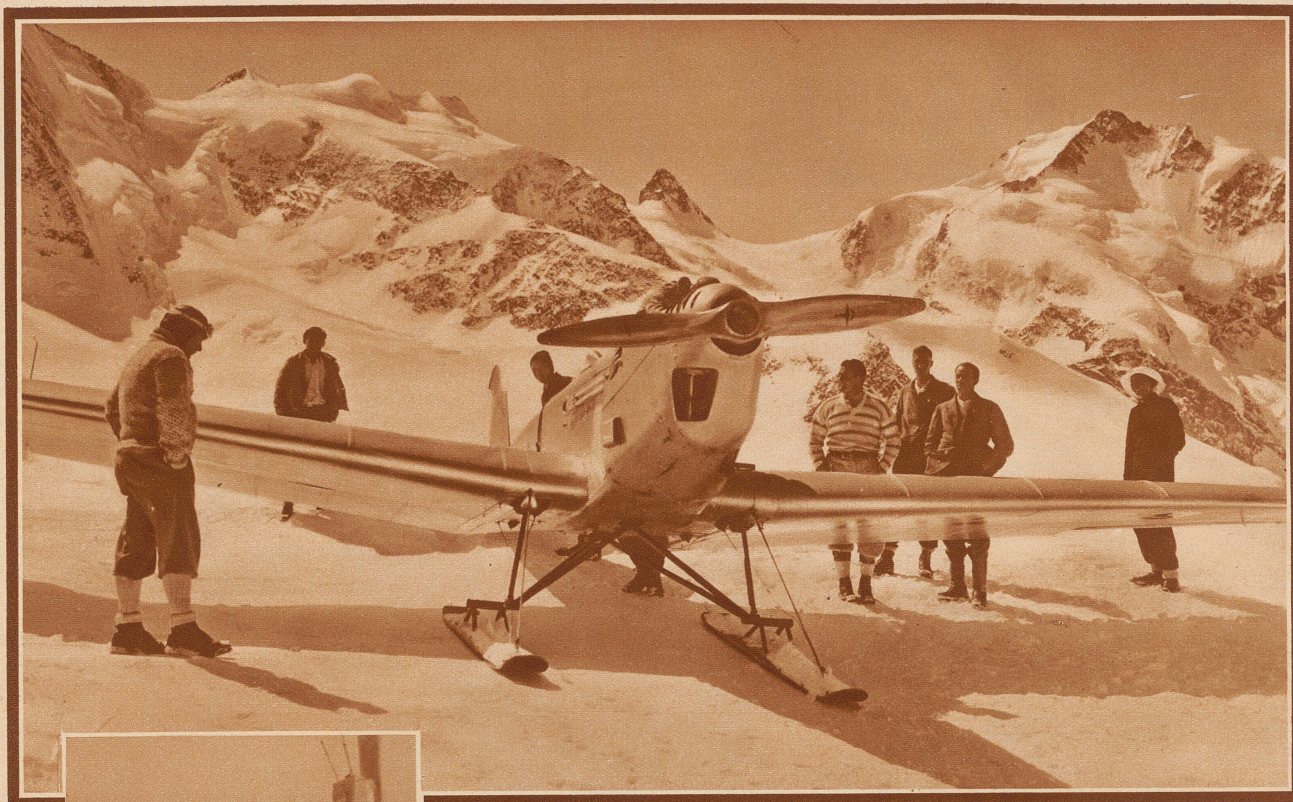
Glatte Landung im Hochgebirge. Dem bekannten deutschen Kunstflieger Udet, der sich augenblicklich in Pontresina aufhält, gelang vergangene Woche eine Flugzeuglandung auf 2977 Meter Höhe neben der Diavolezza-Hütte. – Die auf Skiern montierte Maschine auf dem Gletscher, links Udet, im Hintergrund Bella Vista, Crast-Agüzza und Piz Bernina