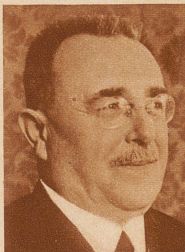
Dr. h. c. E. Buomberger Chefredaktor der «Neuen Zürcher Nachrichten» wurde an Stelle des verstorbenen Polizeivorstandes U. Ribl in den Staderrat von Zürich gewählt

In der neuerbauten, ausgedehnten Markthalle von Burgdorf fand vom 29. März bis 2. April die dritte schweizerische Ausstellung landwirtschaftlicher Maschinen und Geräte statt. An der Ausstellung beteiligten sich 96 schweizerische Maschinenfabrikanten und -Händler mit über 800 Maschinen. Bild: Bundesrat Minger beim Gang durch die Ausstellung