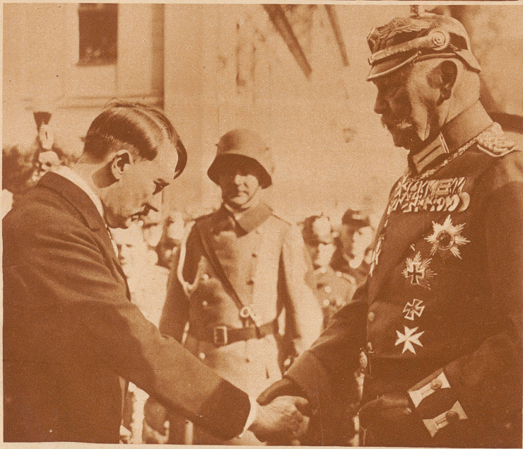
Der Reichskanzler Hitler und der Reichspräsident Hindenburg bei der Parade in Potsdam, welche auf die feierliche Reichstagsöffnung folgte