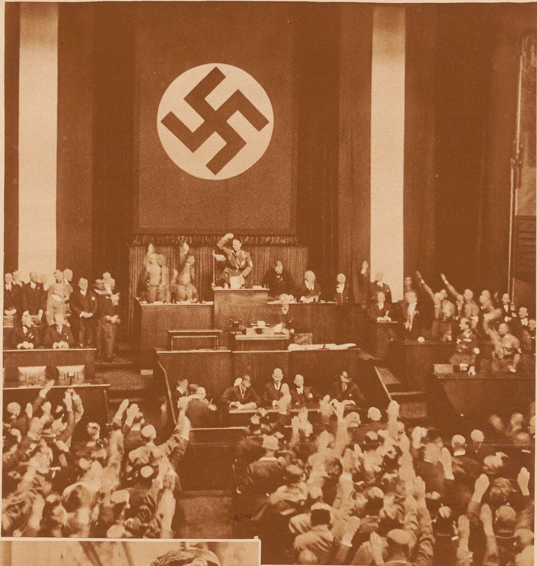
Die Sitzung in der Kroll-Oper in Berlin. Der Präsident Goering und die nationalsozialistische Fraktion beim Hitlergruß