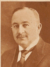
Alexander Baltis von Aadorf, seit 1914 schweizerischer Konsul in Abo (Finnland), starb 64jährig. Nach dem Zusammenbruch in Rußland hat er sich große Verdienste um die Heim-schaffung der Rußland-schweizer erworben