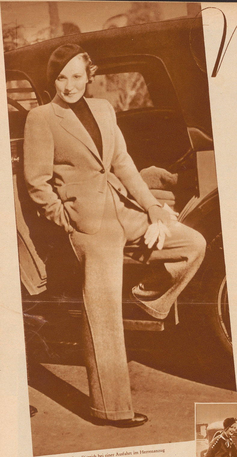
Marlene Dietrich bei einer Ausfahrt im Herrenanzug