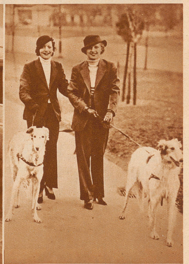
in New York