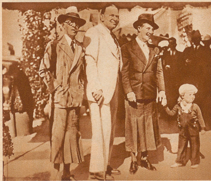
Das einzig Richtige: Proteststreik der Männer. Gegen die Frauen - Hosenmode, die durch das Beispiel Marlenes plötzlich über Amerika herein- gebrochen ist, protestieren hier zwei empörte Männer, indem sie in Damenkleidern in den Straßen Hollywoods spazierengehen

Aus Hollywood kommt seltsame Kunde: Marlene Dietrich, internationaler Inbegriff aller schönen Weiblichkeit, lanciert eine maskuline Damenmode; tagsüber trägt sie mit vollendeter Grazie den Sakko und den ledernen Autodress, abends zu den Filmpremièren Smoking und Frack. Hat sie einen Ueberdruß vor der ewigen Betonung ihrer Reize, daß sie sich wie ein lebenslustiger junger Mann gebärdet? Schon wird die neue Mode auch bei den Frauen Amerikas und Englands populär . . . .