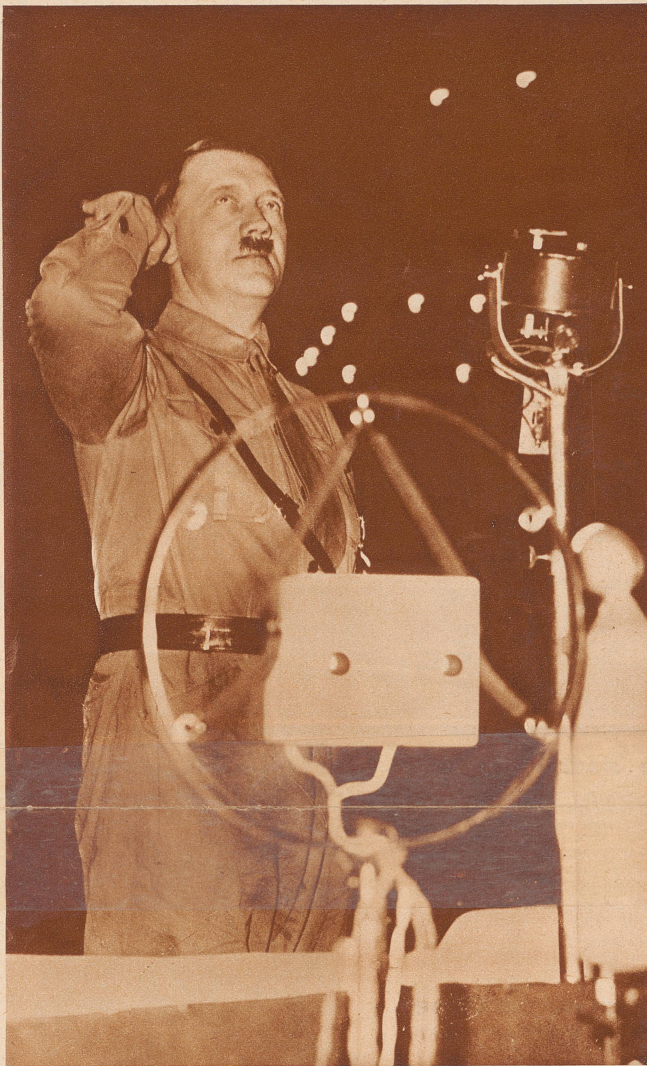
Diese Aufnahme Hitlers zeigt besonders deutlich, was ihn zum kritiklos bewunderten Führer von 17 Millionen Menschen machte: Er appelliert, – selbst hingerissen – an Gefühle und Instinkte, an die politische Leidenschaft und Inbrunst