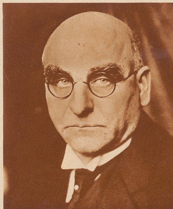
Der ehemalige preussische Ministerpräsident, Dr. Otto Braun, ein prominenter Führer der Sozialdemokratie Deutschlands, verließ am 4. März Deutschland und reiste in die Schweiz, noch bevor durch den Ausgang der Wahlen der neue Kurs definitiv gesiegt hatte. Braun hat ein Besitzrum in Ascona