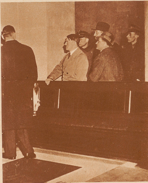
Der Reichskanzler auf der Brandstätte

Mehr als 30 Brandherde sind in dem Sitzungssaal und in den Wandelhallen festgestellt worden. In dem schwerfälligen Schnitzwerk der Wandverkleidung und Bestuhlung fand das Feuer günstige Nahrung. Um 21.15 Uhr wurde der Brand bemerkt, eine halbe Stunde später war der 29 Meter lange, 22 Meter breite und 14 Meter hohe Plenarsaal ein einziges Flammenmeer. Um 23 Uhr war das Feuer auf den Mittelbau beschränkt. Äußerlich zeigt das Reichstagsgebäude, das 1884 aus den Mitteln der französischen Kriegsschädigung von 1871 von dem Architekten Wallot begonnen und 1894 von Wilhelm II. eingeweiht wurde, nur wenige Spuren der Zerstörung. Der Wiederaufbau des Gebäudes wird mindestens 7-8 Monate dauern. Unterdessen soll der Reichstag im ehemaligen preußischen Herrenhaus an der Leipzigerstraße tagen