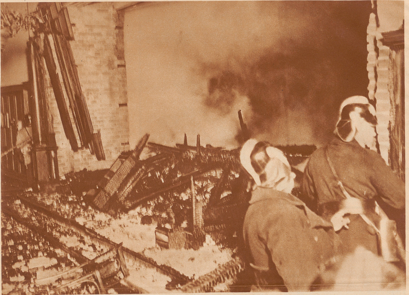
Blick in den vollständig ausgebrannten Plenarsaal des Reichstags

Mehr als 30 Brandherde sind in dem Sitzungssaal und in den Wandelhallen festgestellt worden. In dem schwerfälligen Schnitzwerk der Wandverkleidung und Bestuhlung fand das Feuer günstige Nahrung. Um 21.15 Uhr wurde der Brand bemerkt, eine halbe Stunde später war der 29 Meter lange, 22 Meter breite und 14 Meter hohe Plenarsaal ein einziges Flammenmeer. Um 23 Uhr war das Feuer auf den Mittelbau beschränkt. Äußerlich zeigt das Reichstagsgebäude, das 1884 aus den Mitteln der französischen Kriegsschädigung von 1871 von dem Architekten Wallot begonnen und 1894 von Wilhelm II. eingeweiht wurde, nur wenige Spuren der Zerstörung. Der Wiederaufbau des Gebäudes wird mindestens 7-8 Monate dauern. Unterdessen soll der Reichstag im ehemaligen preußischen Herrenhaus an der Leipzigerstraße tagen