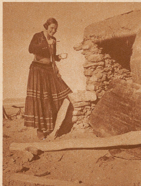
Beim Zähneputzen in der Indianer-Wüste