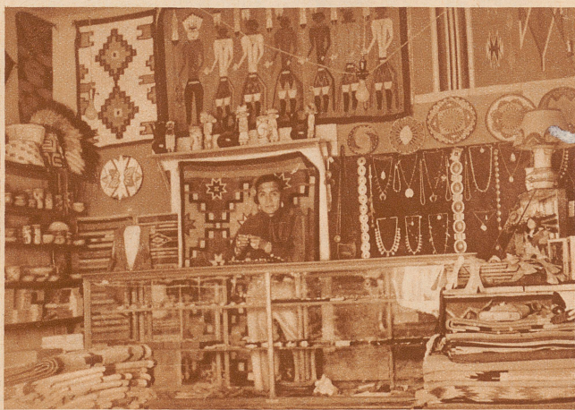
. . . . für gewöhnlich verkaufte er Indianer-Kuriositäten in einem kleinen Städtchen Arizonas