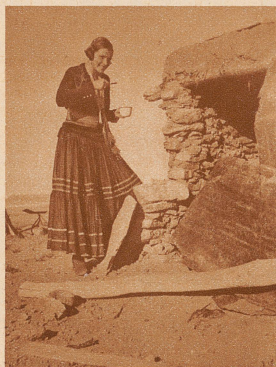
Beim Zähneputzen in der Indianer-Wüste