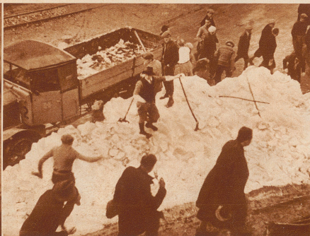
Innsbruck liegt 370 Meter ü. M. Die FIS-Rennen litten sehr unter dem Schneemangel. Um die Sprungschanze fahrbar zu halten, mußte der Schnee wagenladungsweise auf Lastautomobilen hergefahren und in Tragkörben zur Piste befördert werden