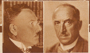
Oberrichter Jak. Feuz

Bern starb 54 Jahre alt. 1910 bis 1919 war er Gerichtspräsident von Obersimmental. 1919 wurde er ins bernische Obergericht gewählt. In der Armee bekleidete er den Rang eines Justizobersten