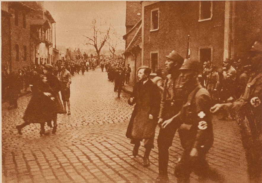
Der kleine Bürgerkrieg in Deutschland: Die Vorgänge in Eisleben. Bei der jetzigen politischen Hochspannung in Deutschland kommt es allorten zu kleineren und größeren Entladungen, zu politischen Straßenmorden und Ueberfällen. Einer der schwersten Zusammenstöße war der in Eisleben vom 12. Februar: Teilnehmer einer national-sozialistischen Demonstration wurden aus einer Buchhandlung von Kommunisten beschossen; bei dem darauffolgenden regelrechten Feuergefecht, an dem sich auch die Polizei beteiligte, gab es drei Tote und siebzehn Schwerverletzte; unter ihnen befand sich auch ein kommunistischer preussischer Landtagsabgeordneter. Zwei große Zeitungen, der sozialdemokratische «Vorwärts» und das «8-Uhr-Abendblatt» wurden wegen ihrer Berichterstattung über diese Vorgänge verboten