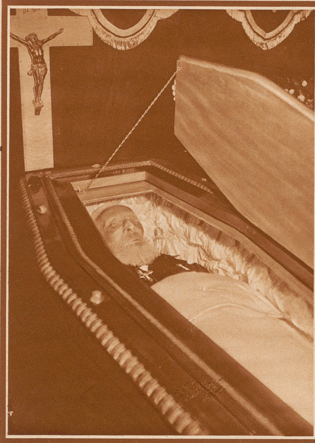
Graf Albert Apponyi

der Führer der ungarischen Delegation an der Abrüstungskonferenz, starb 86jährig an den Folgen einer Grippe