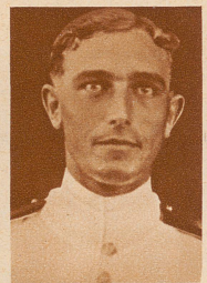
Die Meuterei bei der holländischen Marine in Insulinde