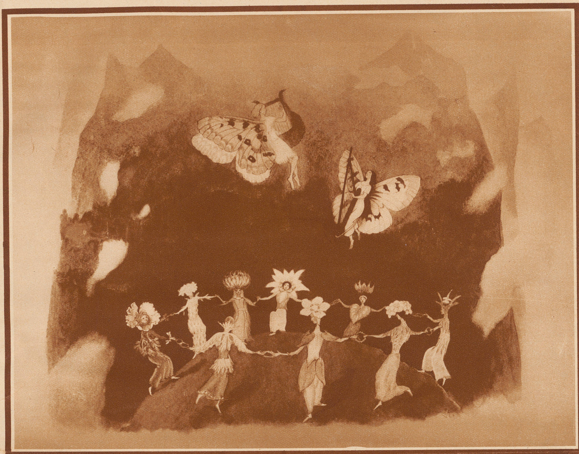
«Parnass» (Aus dem Werk «Bergblumen»)