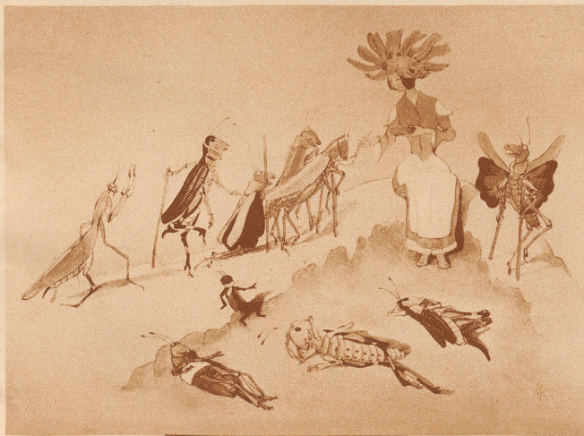
Frau Arnika pflegt die kranken Tiere (Aus «Bergblumen»)

Es gibt unter den heute Erwachsenen Unzählige, deren Kindheitshimmel bevölkert war von den lieblichen und lustigen, den halb irdischen, halb zauberhaften Wesen der Kreidolf'schen Welt. Dazumal wie heute leben die Kinder beglückt mit Frau Bohne und Frau Erbse, mit der schönen Frau Georgine und ihren Kindern, mit Herrn Schlüsselblum und Frau, mit den diebischen Nachtschattengewächsen und mit den geliebten Wiesenzwergen. Daß das keine gewöhnlichen vergänglichen Bilderbücher, sondern die Werke eines großen Künstlers sind, wußten die Kinder noch nicht. Die inzwischen Herangewachsenen aber wissen es und werden am 9. Februar dankbar des Siebzigjährigen gedenken.