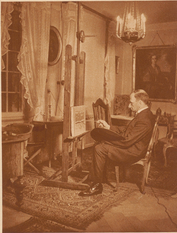
Ernst Kreidolf bei der Arbeit