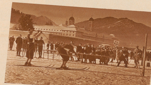
Ein spannender Mo- ment des Langlaufes am Ziel auf der Klosterwiese. 2 Läu- fer fahren ein. Voller Spannung wird von den Chronometreuren der Augenblicke er- wartet, in dem die Ziel- linie überfahren wird