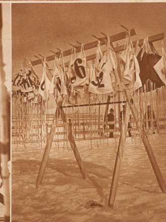
Nummern, die ebenfalls liefen. Am Ziele angelangt, müssen die Läufer ihre Startnummern abgeben