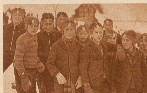
Die Einsiedler Schulbuben hatten bei diesem Fest auch ihren großen Tag. Sie durften die Sprungski der «Kanonen» wieder zur Sprungchance herauftragen