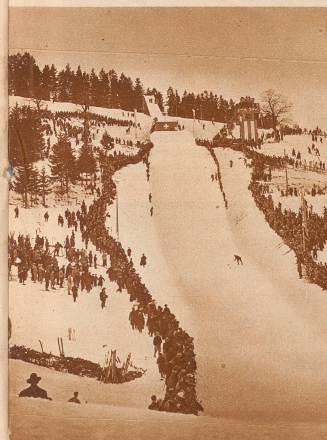
Generalansicht über die Einsiedler Sprunganlage am Freiherrenberg